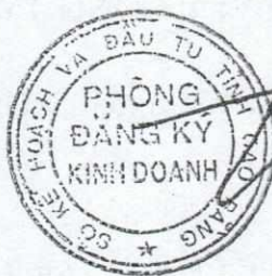
Vũ Trường Sơn