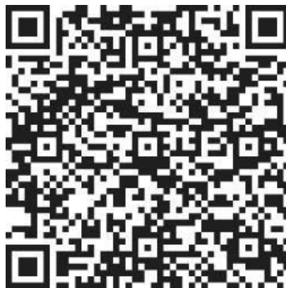
Mã QRcode HMTN phường Tĩnh Gia 01/02/2026

1. BCĐ tỉnh Thanh Hóa quy định mã QRcode cho phường Tĩnh Gia năm 2026, cụ thể như sau: