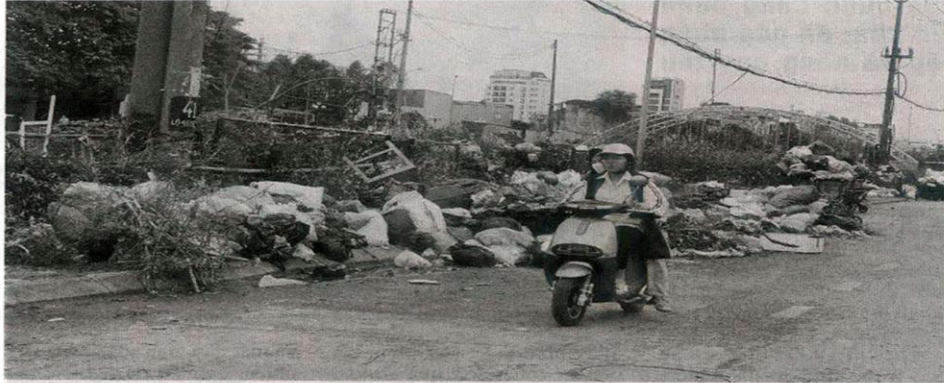
Rác thải sinh hoạt sau dịp Tết Nguyên đán bị ùn ứ tại nhiều phường trung tâm của tỉnh Thanh Hóa.

Sau nhiều lần xảy ra tình trạng ùn ứ rác thải tại các phường trung tâm của tỉnh Thanh Hóa, ngành chức năng đang khẩn trương đưa ra các giải pháp nhằm xử lý vấn đề trên.