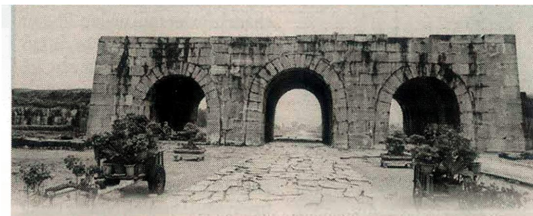
Thành nhà Hồ trở thành di sản văn hóa do UNESCO ghi danh

Tam hoàng, tổ khai sinh ra nền văn minh Hoa Hạ. Dĩ nhiên, lời tuyên bố của Tào Tháo chỉ là võ đoán nhất thời. Bởi vậy đến khi Tào Tháo mất, có lẽ đã chẳng còn nhớ tới những lời cha nói, Tào Thực viết diếu văn, nhận cha mình đến từ họ Cơ, hậu duệ của nhà Chu. Câu chuyện truy xuất dòng tộc tưởng đã có thể dừng lại. Song đến lượt cháu nội Tào Tháo là Ngụy Minh Đế Tào Duệ, sau khi lên ngôi vẫn ôm trong lòng ám ảnh nguồn cội giống hệt ông và chú, lúc này nghe theo kiến nghị của Cao Đường Long, hạ chiếu tuyên bố các thế hệ họ Tào là hậu duệ của vua Thuấn, xuất phát từ họ Ngu. Chính bởi cùng một dòng tộc mà ba đời “bắt quàng” lấy ba ông tổ khác nhau, không có đến một mảnh chứng cứ, đời sau mới coi là câu chuyện nực cười.