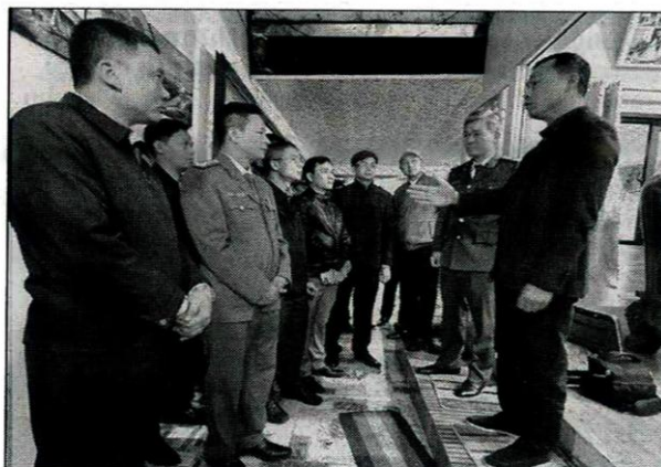
Lãnh đạo Công an tỉnh Thanh Hóa chỉ đạo các đơn vị nghiệp vụ điều tra tại hiện trường vụ án