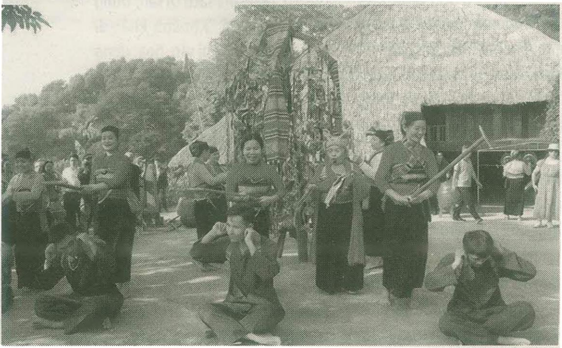
Lễ hội Pôôn Pông.

tiếp tục gìn giữ bản sắc, củng cố đoàn kết cộng đồng và phát triển bền vững trên chính quê hương mình.