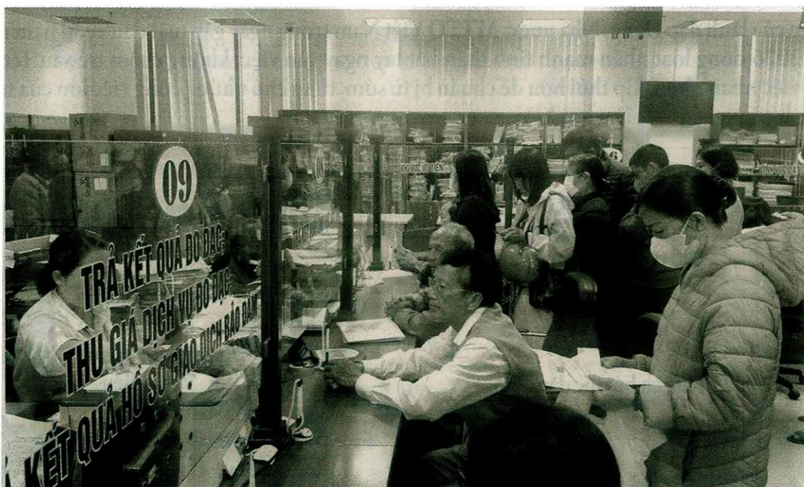
Cán bộ phường Hạc Thành (tỉnh Thanh Hóa) bắt tay vào công việc ngay từ những ngày đầu năm để phục vụ nhân dân.