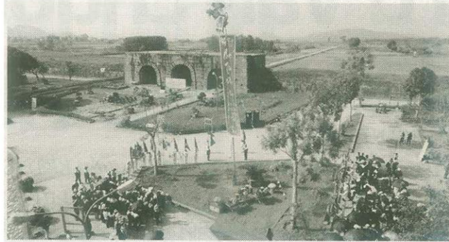
Nghi lễ dựng cây nêu ngày Tết được tái hiện tại khu vực Cổng Nam di sản thế giới Thành nhà Hồ

Nhân dịp Tết Nguyên Đán Bính Ngọ 2026, Ban Quản lý Di sản Thành nhà Hồ và Các di tích trọng điểm tỉnh Thanh Hóa triển khai chương trình "Mừng Đảng, mừng xuân" với nhiều hoạt động văn hóa, nghệ thuật đặc sắc, tái hiện không gian Tết xưa, hướng tới mục tiêu vừa quảng bá hình ảnh Di sản thế giới Thành nhà Hồ, vừa tạo điểm đến văn hóa, du lịch hấp dẫn cho nhân dân và du khách thập phương.