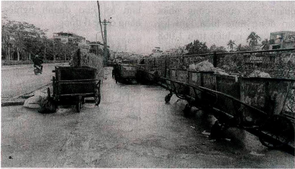
Tính đến ngày 25.2, rác thải bị ùn ứ tại các phường trung tâm của tỉnh Thanh Hóa đã được thu gom, xử lý, các tuyến đường, con phố trở nên sạch sẽ.