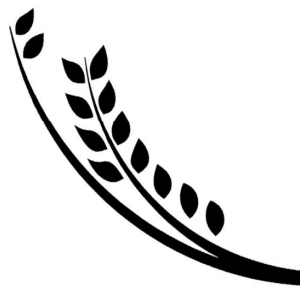
BÔNG LÚA CHÍN MÙA GẶT