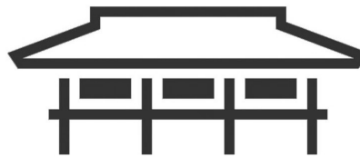
NHÀ SÀN DÂN TỘC