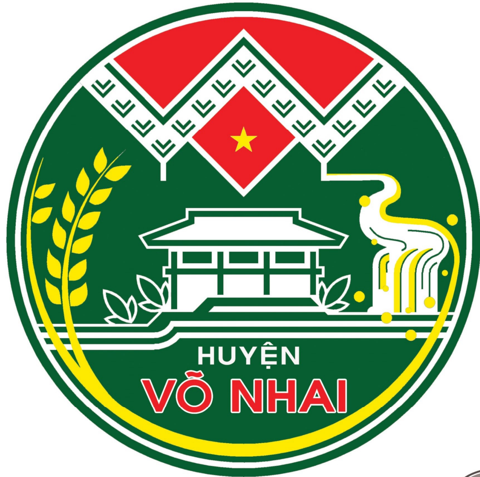
PHƯƠNG ÁN MÀU VÀ PHƯƠNG ÁN ĐƠN SẮC