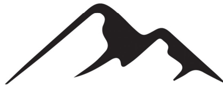
ĐỒI NÚI ĐÁ VÔI HÙNG VĨ