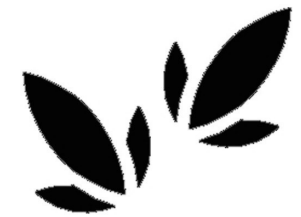
CÂY ĂN QUẢ, CÂY DƯỢC LIỆU