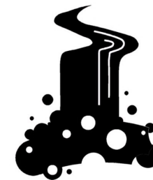
THÁC NƯỚC TẦNG BẬC