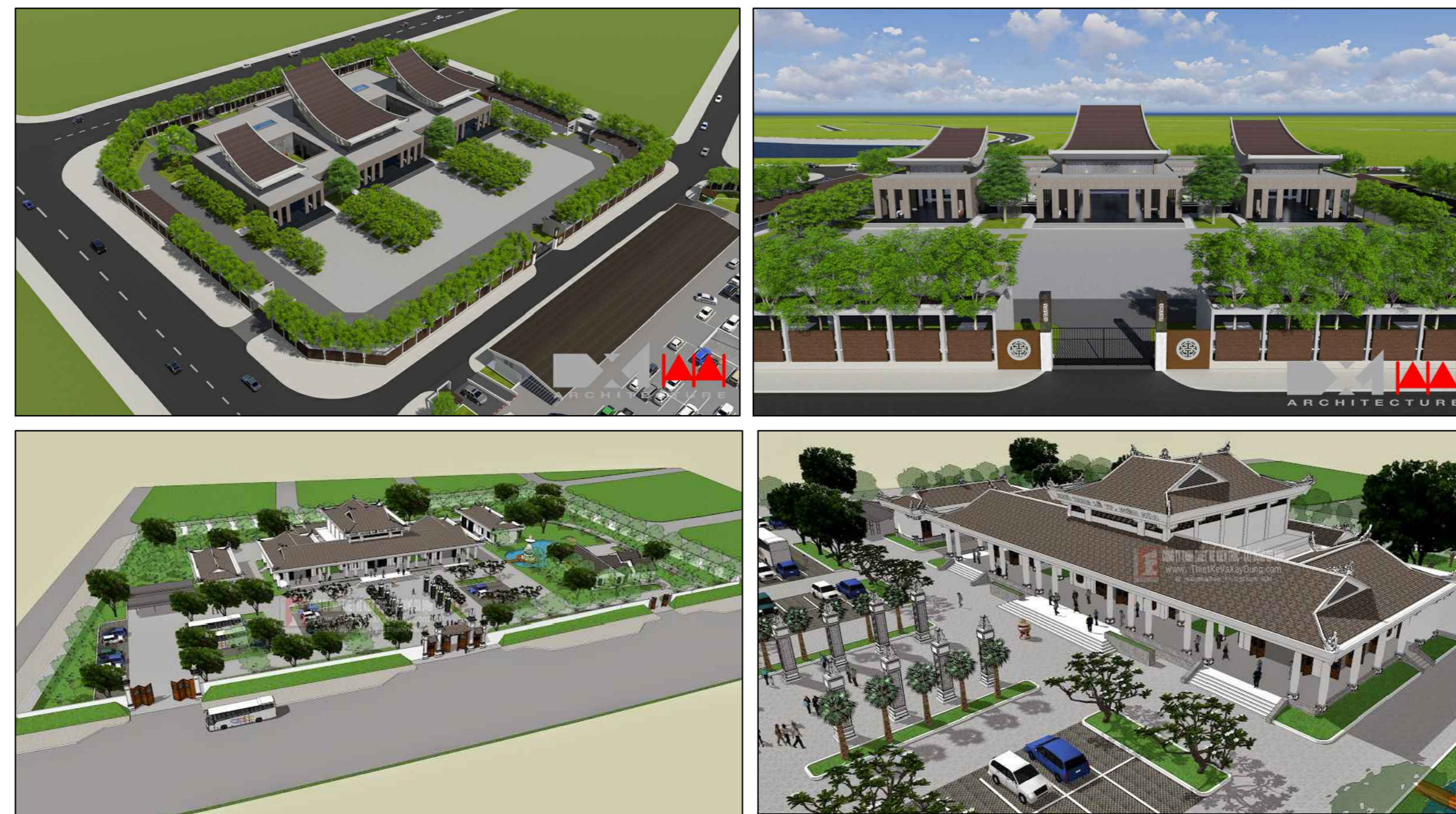
MINH HỌA HÌNH THỨC KIẾN TRÚC NHÀ TANG LỄ