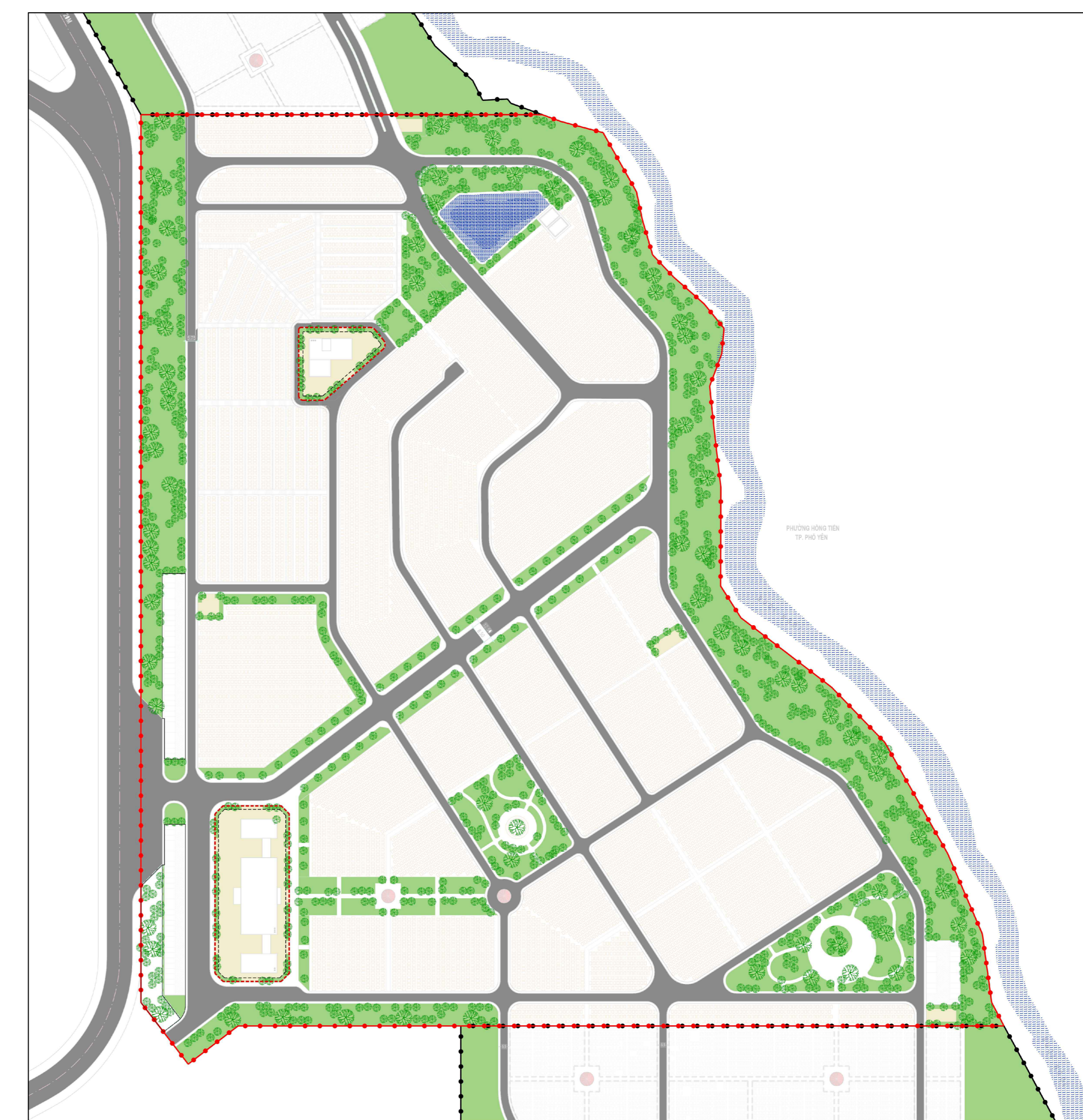
----- KHOẢNG LÙI CÔNG TRÌNH