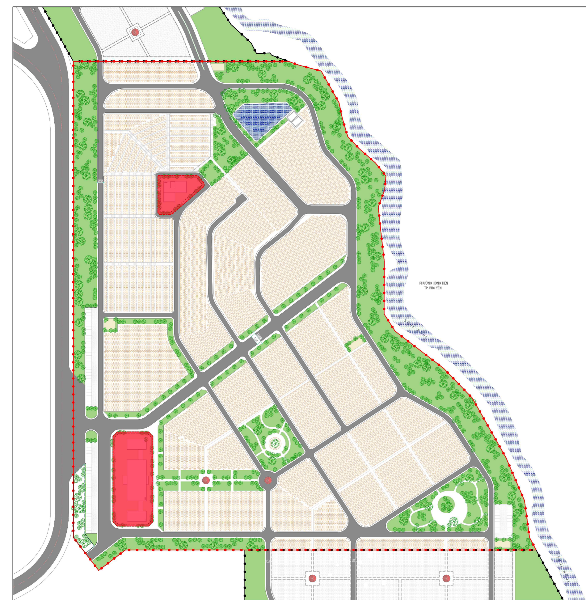
KHU VỰC CÓ TẦNG CAO TỐI ĐA 3 TẦNG, CHIỀU CAO TỐI ĐA 15M

2.1 TỒ CHỨC KHÔNG GIAN VÀ CHIỀU CAO CHO TOÀN KHU VỰC QUY HOẠCH VÀ CỤ THỂ ĐỐI VỚI CÁC KHU ĐẤT