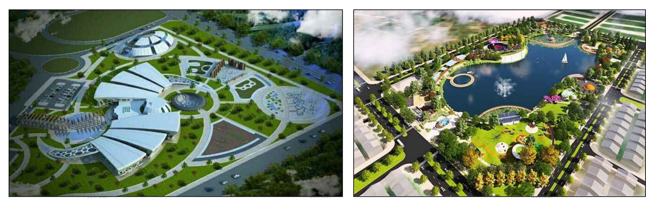
ẢNH MINH HỌA CÔNG TRÌNH, CÂY XANH, CẢNH QUAN