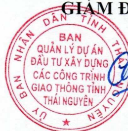
Ngô Mạnh Cường