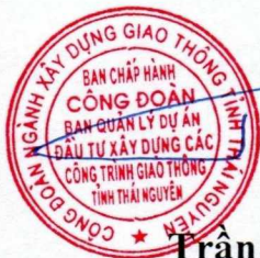
Trần Xuân Tú