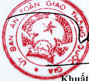
Khuất Việt Hùng