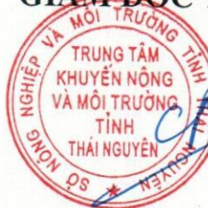
Chu Bá Trung