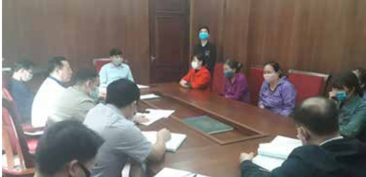
Tiếp công dân tại Trụ sở Tiếp công dân tỉnh

Đối với công tác TXCT, theo dõi việc giải quyết ý kiến kiến nghị của cử tri tiếp tục được đổi mới, đảm bảo dân chủ, phát huy vai trò, trách nhiệm của đại biểu dân cử, của cử tri và của các cơ quan, tổ chức, đơn vị liên quan trong triển khai thực hiện. Văn phòng đã tham mưu Thường trực HĐND tỉnh ban hành hướng dẫn tiếp xúc cử tri trước và sau các kỳ họp, trong đó chú trọng đổi mới theo hướng thiết thực, hiệu quả, giảm tính hình thức, thông qua việc mở rộng thành phần,