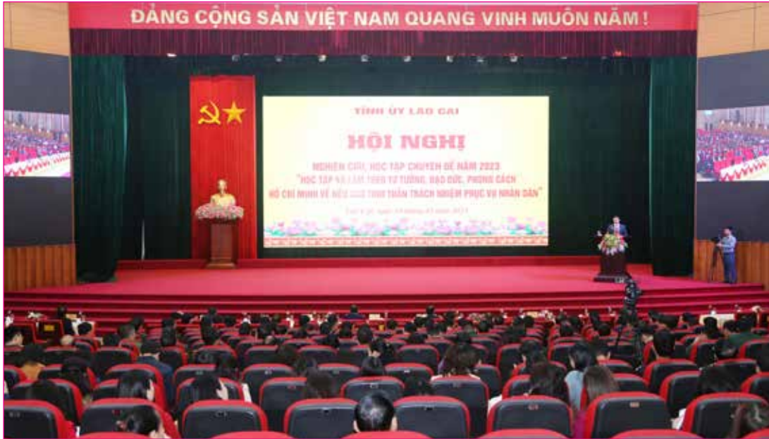
Thường trực HĐND, lãnh đạo các Ban HĐND, lãnh đạo và công chức Văn phòng tham dự Hội nghị nghiên cứu, học tập chuyên đề năm 2023