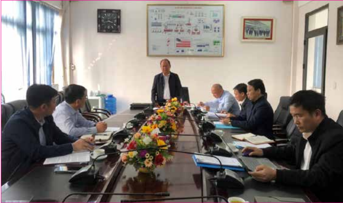
Đoàn ĐBQH phối hợp với Ban Kinh tế - Ngân sách HĐND tỉnh giám sát tại Công ty Luyện đồng Lào Cai