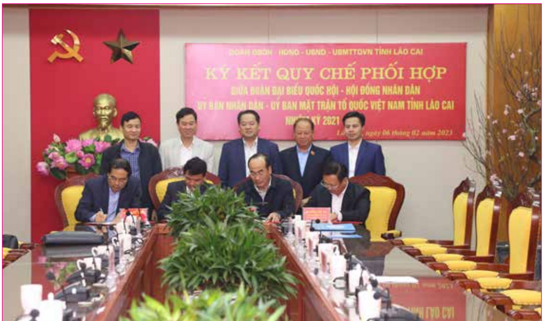
Ký kết Quy chế phối hợp giữa Đoàn ĐBQH - HĐND - UBND - Ủy ban MTTQ Việt Nam tỉnh Lào Cai