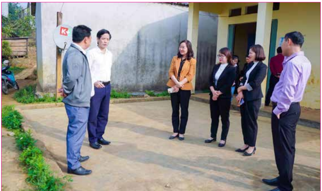
Ban Văn hóa - Xã hội HĐND tỉnh giám sát về thiết chế văn hóa tại huyện Mường Khương