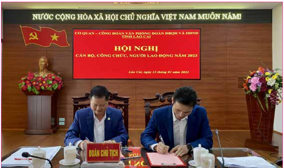
Chánh Văn phòng và Chủ tịch Công đoàn cơ sở Văn phòng Đoàn ĐBQH và HĐND tỉnh ký kết giao ước thi đua