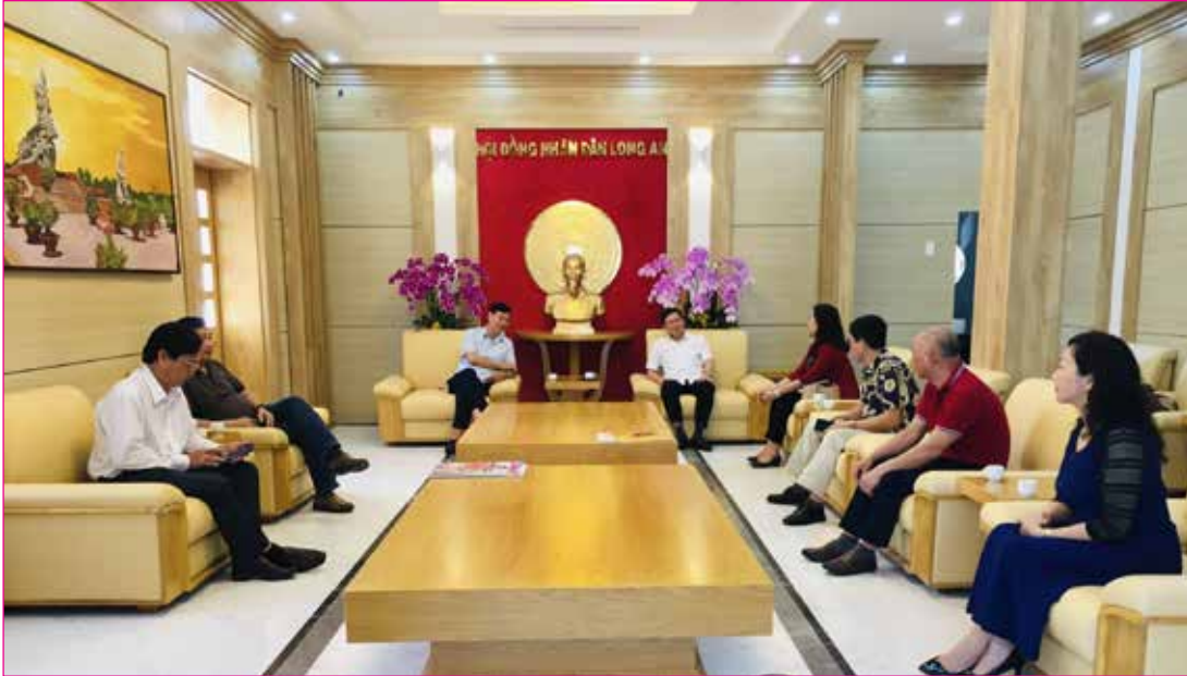
Thường trực, các Ban HĐND tỉnh trao đổi kinh nghiệm hoạt động với Thường trực, các Ban HĐND tỉnh Long An