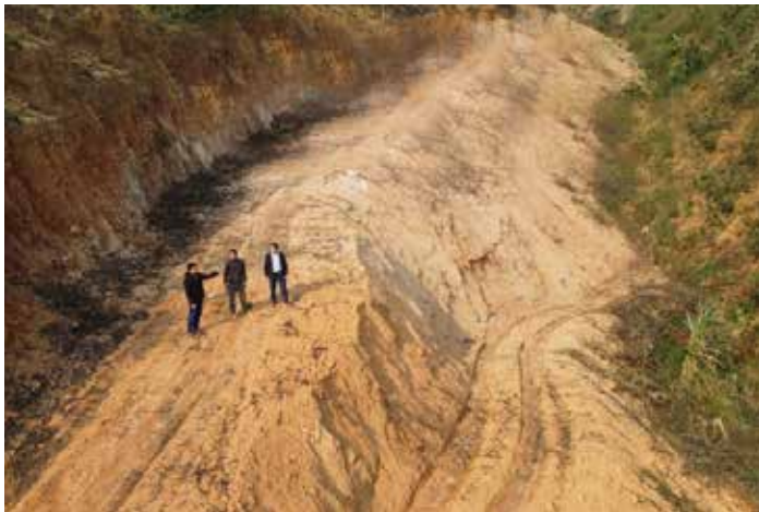
Kim Sơn - Đường rộng mở nhờ lòng dân đồng thuận

Trò chuyện với chúng tôi, ông Nguyễn Thành Công, Chủ tịch UBND xã còn kể thêm nhiều câu chuyện về những hộ xung phong hiến đất làm đường. Ví dụ như một số hộ đề nghị xã điều chỉnh tuyến đường qua giữa ruộng nhà mình để đường được thẳng, sau này đi lại thuận tiện hơn; có hộ không hiến đất nhưng sẵn