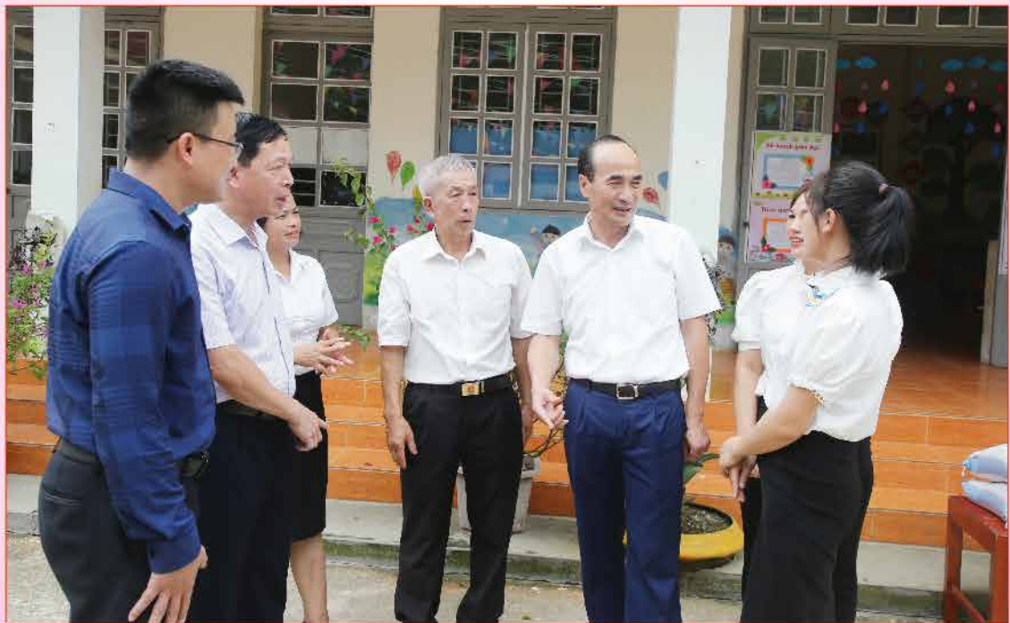
Đồng chí Vũ Xuân Cường, Phó Bí thư Thường trực Tỉnh ủy, Chủ tịch HĐND tỉnh tiếp xúc cử tri thành phố Lào Cai.