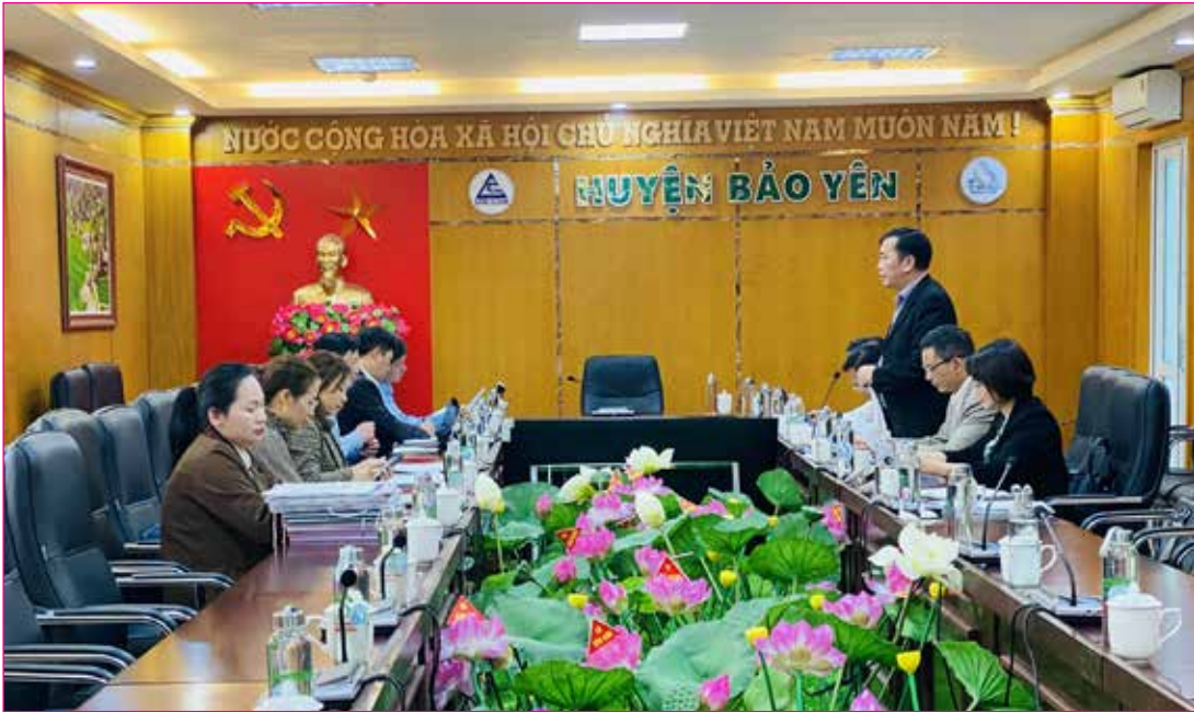
Ban Pháp chế HĐND tỉnh giám sát việc thực hiện các quy định của pháp luật trong hoạt động công chứng, chứng thực tại huyện Bảo Yên