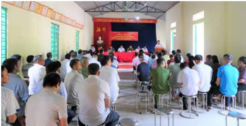
Hội nghị TXCT hai cấp tỉnh, huyện tại xã Thanh Bình,

Bên cạnh những kết quả đã đạt được vẫn còn một số tồn tại như, trong công tác chuẩn bị cho kỳ họp HĐND xã đã được Thường trực Đảng ủy, HĐND, UBND xã quan tâm, chỉ đạo triển khai thực hiện, tuy nhiên vẫn còn một số tồn tại, dự thảo nghị quyết còn gửi chậm, phần nào ảnh hưởng đến việc nghiên cứu, thẩm tra, thảo luận của đại biểu, các Ban HĐND xã; Ban HĐND xã còn chưa phát huy hết vai trò, mối liên hệ giữa các Tổ đại biểu HĐND với Thường trực HĐND còn chưa chặt chẽ; thực hiện chế độ thông tin báo cáo còn chưa kịp thời; công tác tuyên truyền, triển khai Nghị quyết của HĐND xã đến các thôn bản hiệu quả chưa cao; công tác giám sát thường xuyên của Thường trực HĐND, các Ban HĐND xã còn hạn chế; các Ban HĐND xã hoạt động kiêm nhiệm nên chưa dành nhiều thời gian nghiên cứu cho các cuộc kiểm tra, giám sát, khảo sát; báo cáo thẩm tra của các Ban chất lượng còn hạn chế; một số đại biểu HĐND chưa mạnh dạn