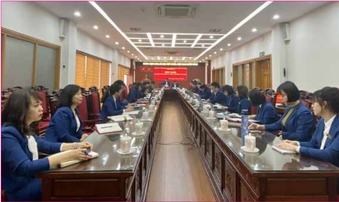
Quang cảnh hội nghị cán bộ, công chức, người lao động Văn phòng Đoàn ĐBQH và HĐND tỉnh năm 2023