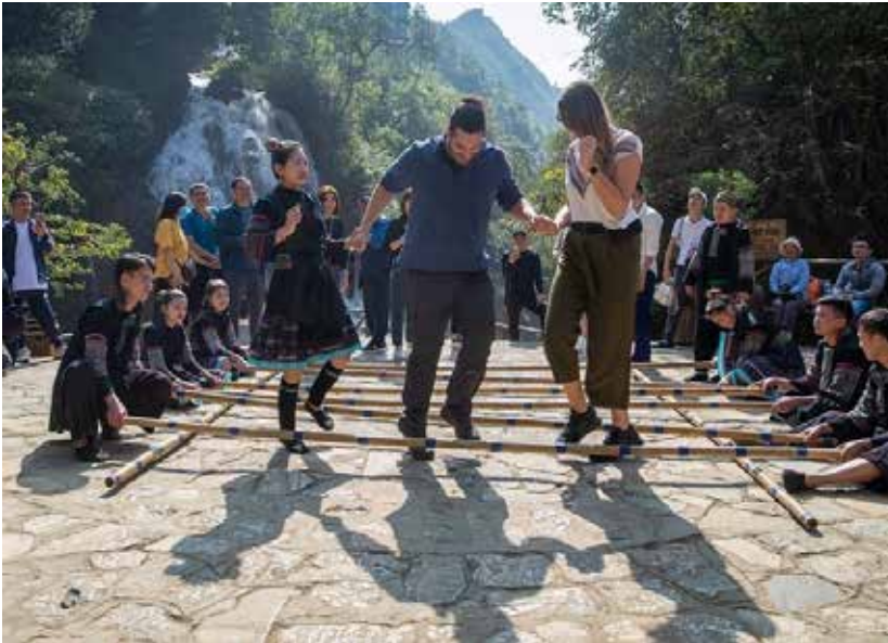
Sa Pa là điểm đến hấp dẫn của du khách quốc tế.

Ngày 20/3/2023, Phó Thủ tướng Chính phủ Trần Hồng Hà ký Quyết định số 266/QĐ-TTg ngày 20/3/2023 của Thủ tướng Chính phủ phê duyệt Quy hoạch chung xây dựng Khu du lịch Quốc gia Sa Pa - thị xã Sa Pa, tỉnh Lào Cai đến năm 2040. Với khu du lịch thường xuyên “quá tải” như Sa Pa, việc phê duyệt quy hoạch này giống như “may chiếc áo mới”, thay cho “chiếc áo đang quá chật”