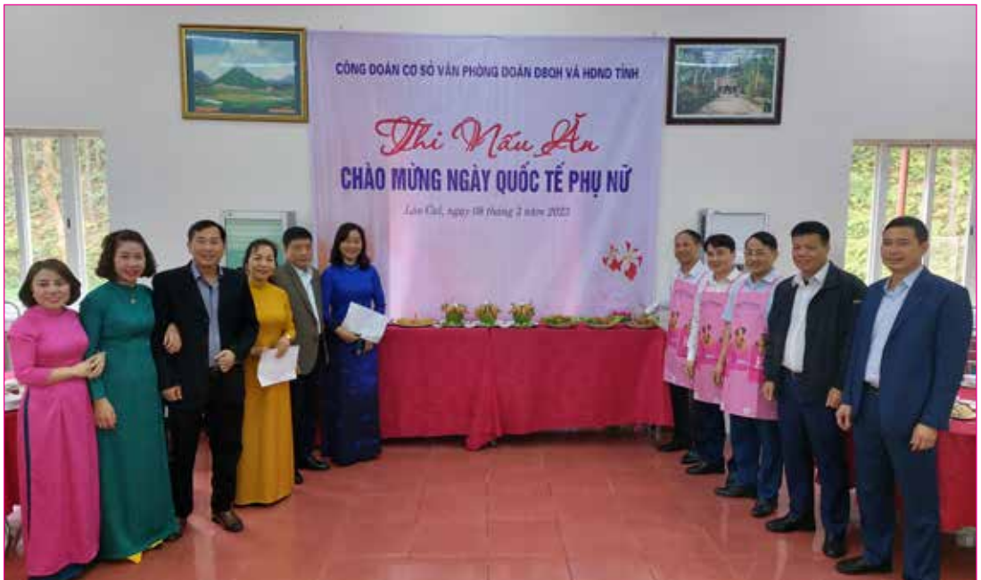
Công đoàn cơ sở Văn phòng Đoàn ĐBQH và HĐND tỉnh tổ chức Thi nấu ăn mừng ngày Quốc tế phụ nữ