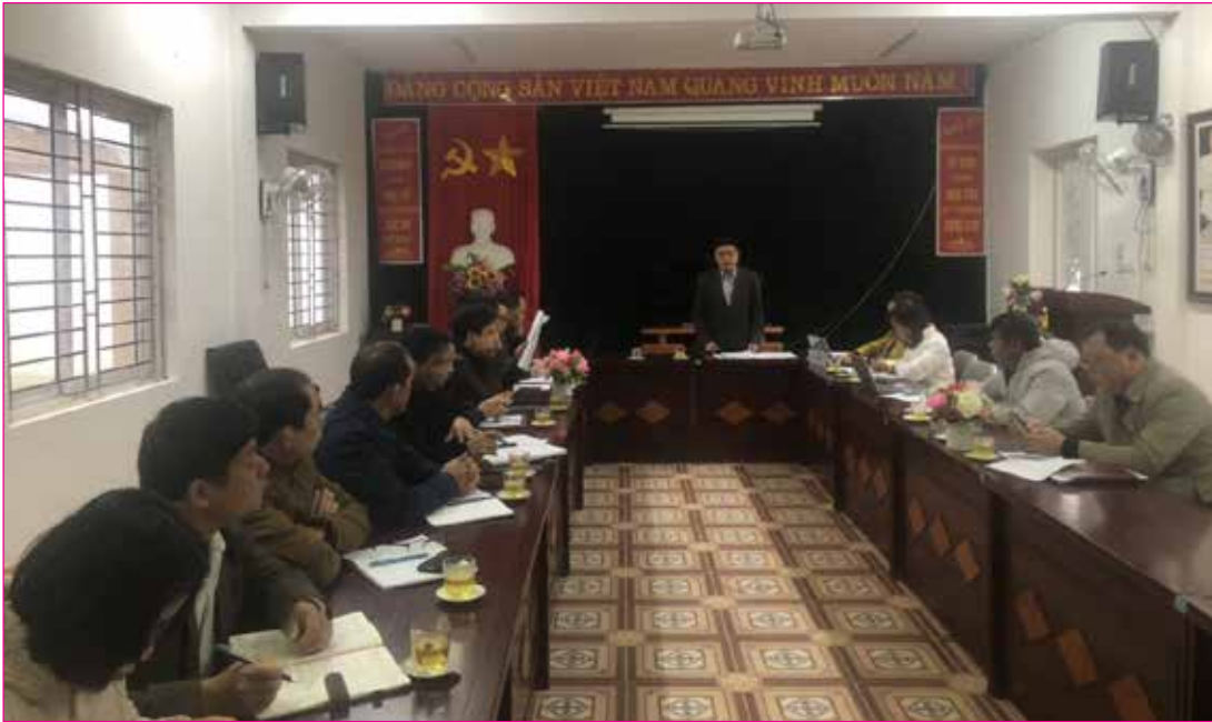
Ban Dân tộc HĐND tỉnh giám sát việc thực hiện chính sách hỗ trợ đầu tư các điểm sắp xếp dân cư nông thôn tại xã Tung Chung Phố, huyện Mường Khương