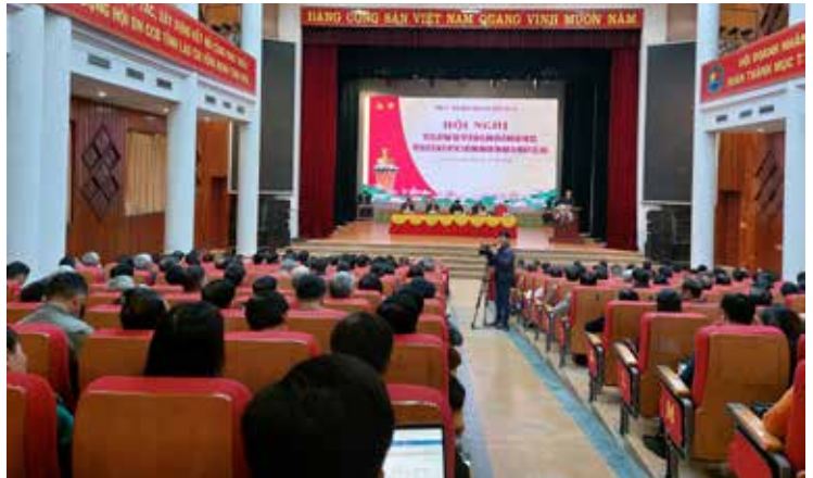
Thường trực HĐND tỉnh phối hợp với Thường trực Tỉnh ủy tiếp xúc đối thoại trực tiếp với cán bộ, đảng viên và Nhân dân; tiếp xúc cử tri sau Kỳ họp thứ 10 HĐND tỉnh khóa XVI.

nghị biết đồng thời đôn đốc, theo dõi và giám sát việc giải quyết. Trong trường hợp xét thấy việc giải quyết khiếu nại, tố cáo, kiến nghị không đúng pháp luật, đại biểu HĐND có quyền gặp người đứng đầu cơ quan, tổ chức, đơn vị hữu quan để tìm hiểu, yêu cầu xem xét lại; khi cần thiết, đại biểu HĐND yêu cầu người đứng đầu