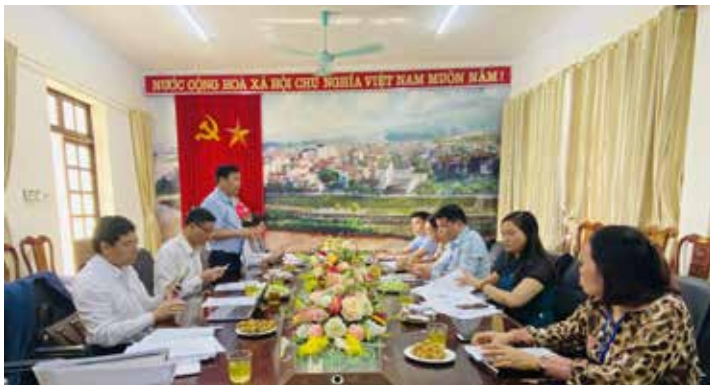
Ban Pháp chế HĐND tỉnh giám sát tại UBND thành phố Lào Cai

thực phải đi trước một bước, định hướng các cơ quan tập trung tuyên truyền, phổ biến nội dung Luật Công chứng, các văn bản hướng dẫn của Chính phủ về hướng dẫn thi hành một số điều của Luật Công chứng, chính sách phát triển nghề công chứng, về cập nhật bản sao từ sổ gốc, chứng thực bản sao từ bản chính, chứng thực chữ ký và chứng thực hợp đồng giao dịch và các văn bản hướng dẫn thi hành bằng nhiều hình thức như: Thông qua các hội nghị tuyên vận, các cuộc họp thôn bản, tổ dân phố, qua hệ thống loa truyền thanh cơ sở, niêm yết công khai thủ tục hành chính về chứng thực, mức thu lệ phí chứng thực tại bộ phận một cửa của UBND thị xã, UBND các xã, phường. Kết quả chỉ tính riêng từ năm 2020 đến năm 2022 UBND thị xã đã chỉ đạo tổ chức được 76 hội nghị tuyên truyền có lồng ghép nội dung đến hoạt động chứng thực với trên 04 nghìn lượt nghe; đồng thời UBND thị xã đã cất cử hàng trăm lượt cán bộ, công chức tham gia các lớp do Bộ Tư pháp và Sở Tư pháp tổ chức tập huấn sử dụng phần mềm công chứng,