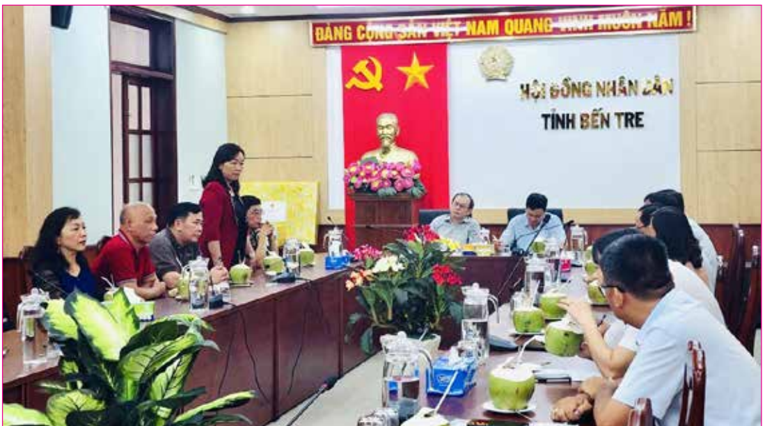
Thường trực, các Ban HĐND tỉnh làm việc với Thường trực, các Ban HĐND tỉnh Bến Tre