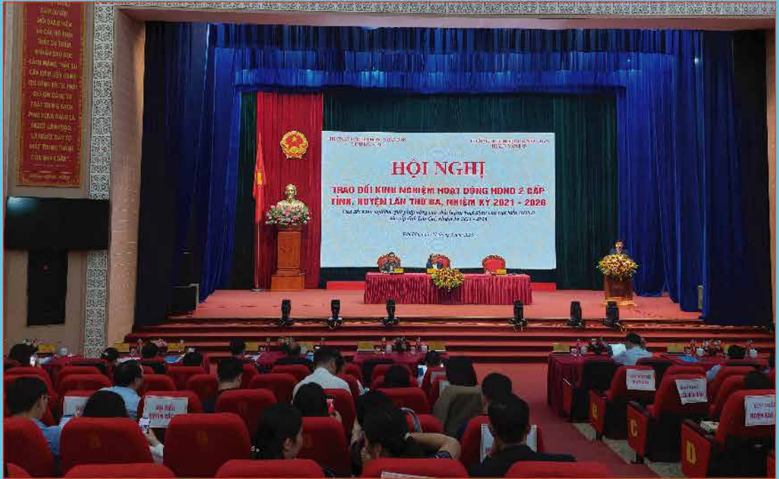
Quang cảnh Hội nghị trao đổi kinh nghiệm hoạt động HDND 2 cấp tỉnh, huyện lần thứ ba, nhiệm kỳ 2021 - 2026