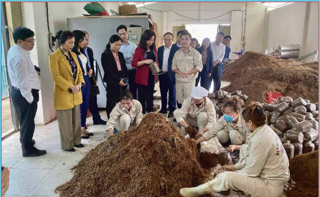
Đại biểu HDND tỉnh, huyện thăm quan mô hình trồng nấm ở xã Liêm Phú, huyện Văn Bàn