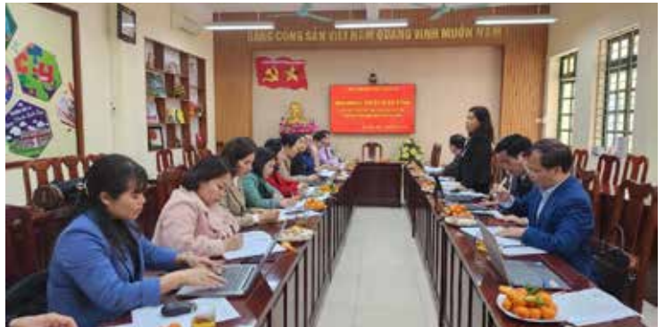
Các Ban HĐND tỉnh khảo sát về mức thu học phí tại thành phố Lào Cai

Tại Kỳ họp ngày 15 tháng 7 năm 2022, Hội đồng nhân dân tỉnh Lào Cai đã ban hành Nghị quyết số 07/2022/NQ-HĐND quy định mức thu học phí năm học 2022- 2023 trên địa bàn tỉnh Lào Cai. Theo đó mức thu học phí tại