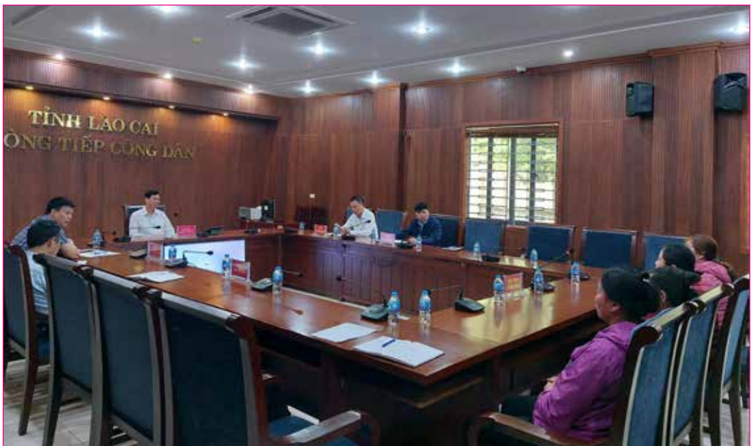
Đồng chí Vũ Văn Cài, Ủy viên Ban thường vụ Tỉnh ủy, Phó chủ tịch Thường trực HĐND tỉnh tiếp công dân