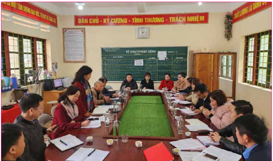
Các Ban HĐND tỉnh phối hợp khảo sát về vấn đề thu học phí tại cơ sở