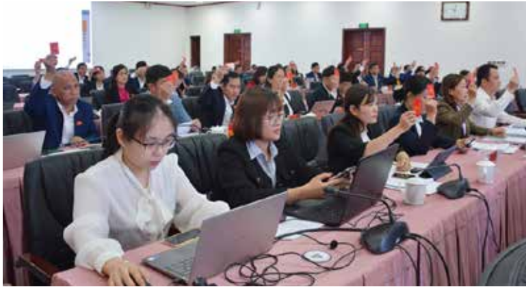
Đại biểu HĐND tỉnh biểu quyết thông qua nghị quyết tại Kỳ họp thứ 11, HĐND tỉnh Lào Cai khóa XVI

3 tháng. Tại kỳ họp này, có 10 nghị quyết được thông qua, đúng như tên của kỳ họp là giải quyết công việc phát sinh, các nghị quyết đều là những nhiệm vụ cấp bách trong quản lý, điều hành, đòi hỏi có chính sách hoặc cần giải quyết kịp thời làm cơ sở thực hiện. Cụ thể là có tới 7/10 nghị quyết liên quan đến đầu tư công, bổ sung dự toán thu, chi ngân sách năm 2023 sau khi Trung ương có một số chính sách điều chỉnh liên quan đến lĩnh vực này và chủ trương đầu tư tại một số dự án. Cũng liên quan đến Kỳ họp giải quyết công việc phát sinh gần đây nhất, Kỳ họp thứ 11, HĐND tỉnh đã thông qua Nghị quyết bãi bỏ quy định về lệ phí đăng ký cư trú tại một số nghị quyết do HĐND tỉnh ban hành trước đây; Nghị quyết về việc hỗ trợ học phí năm học 2022 - 2023 cho trẻ mầm non, học sinh phổ thông công lập, học viên giáo dục thường xuyên trên địa bàn tỉnh