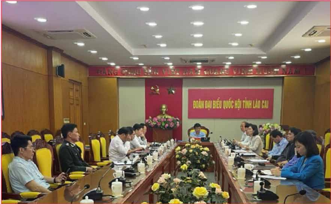
Đoàn ĐBQH tỉnh Lào Cai tham dự phiên chất vấn và trả lời chất vấn của Ủy ban Thường vụ Quốc hội tại điểm cầu Lào Cai.