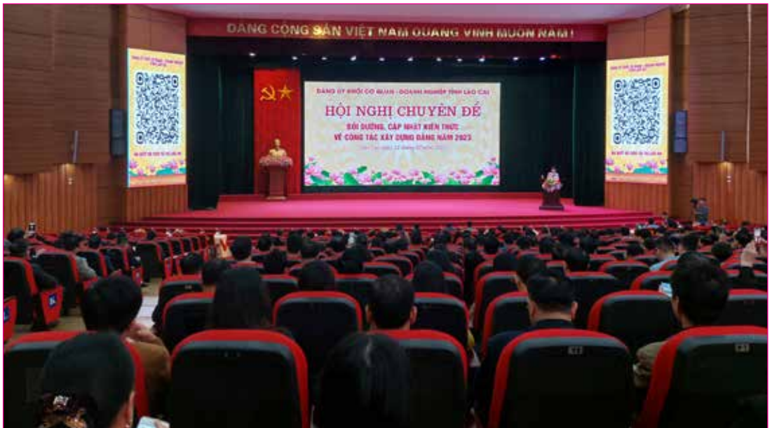
Thường trực HĐND, lãnh đạo các Ban HĐND, lãnh đạo và công chức Văn phòng tham dự Hội nghị chuyên đề bồi dưỡng, cập nhật kiến thức về công tác xây dựng Đảng năm 2023