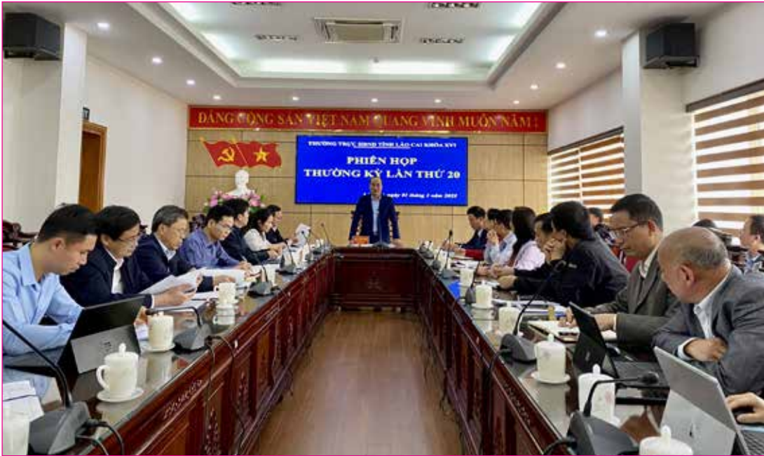
Đồng chí Vũ Xuân Cường, Phó Bí thư Thường trực Tỉnh ủy, Chủ tịch HĐND tỉnh kết luận Phiên họp