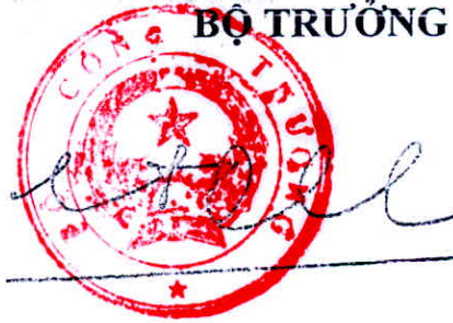
Nguyễn Hồng Diên