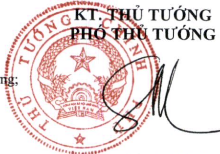
Phạm Bình Minh