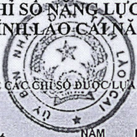
BẢNG THÔNG KÊ CÁC CHỈ SỐ ĐƯỢC LỰA CHỌN