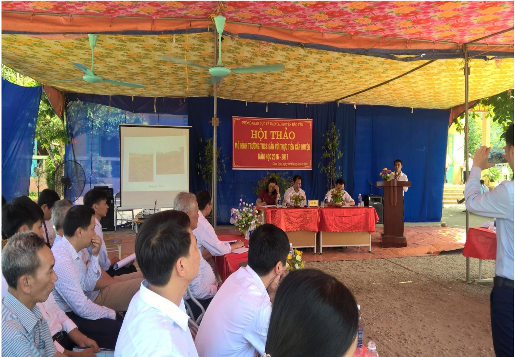
Hội thảo thực hiện mô hình trường học gắn với thực tiễn cấp huyện