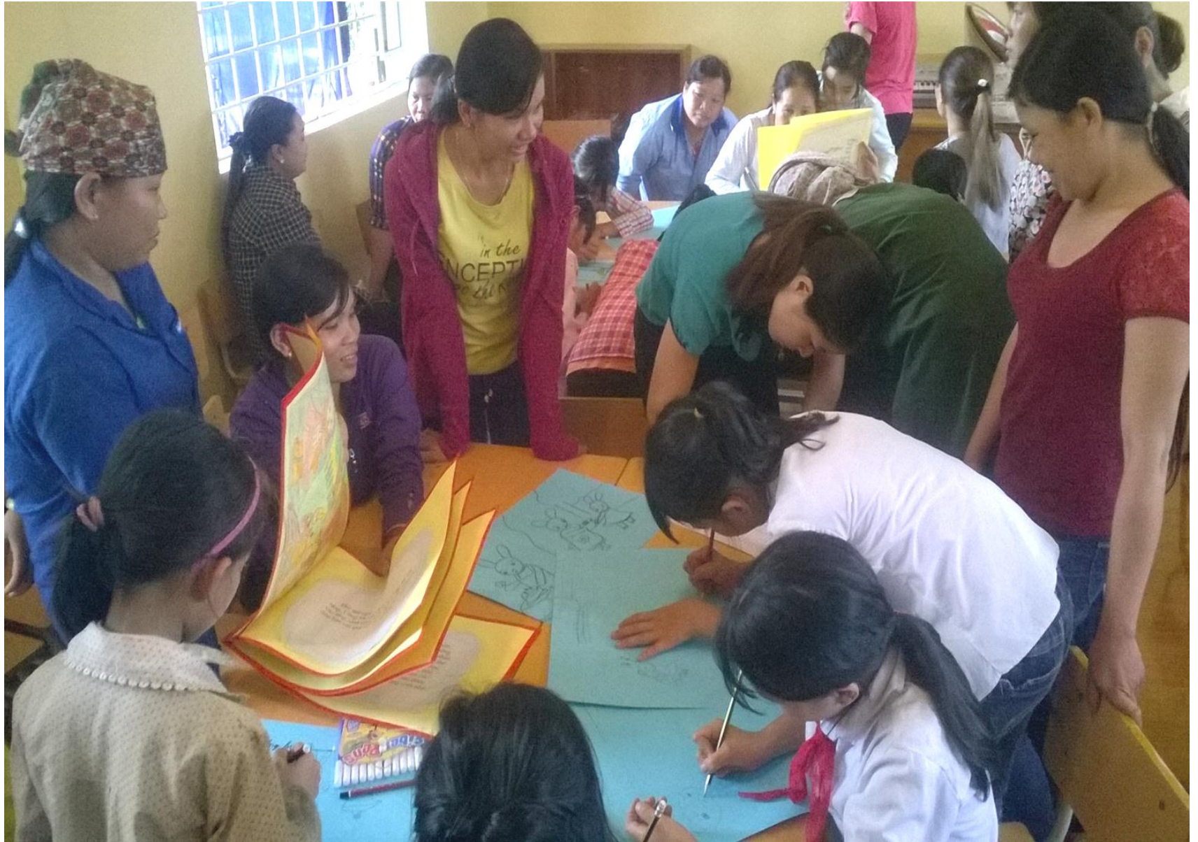
Các phụ huynh hỗ trợ chúng em làm truyện tranh