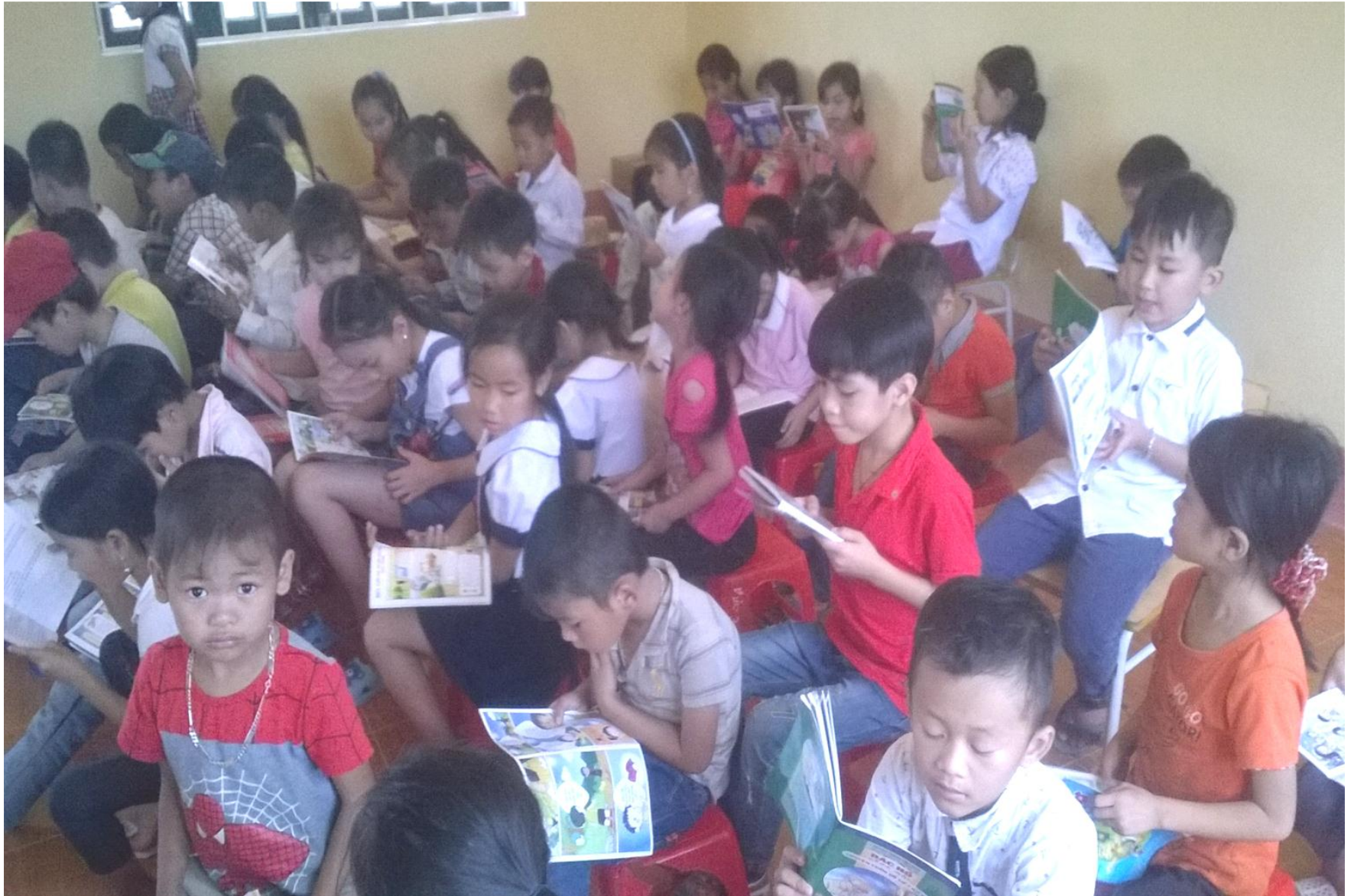
Hoạt động đọc trong hội trại Tiếng Việt