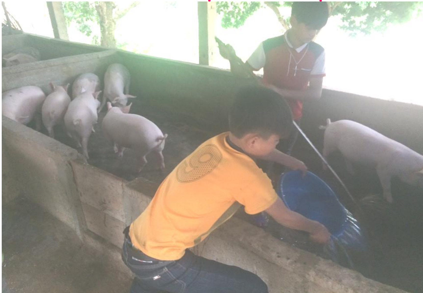
Quét dọn chuồng lợn