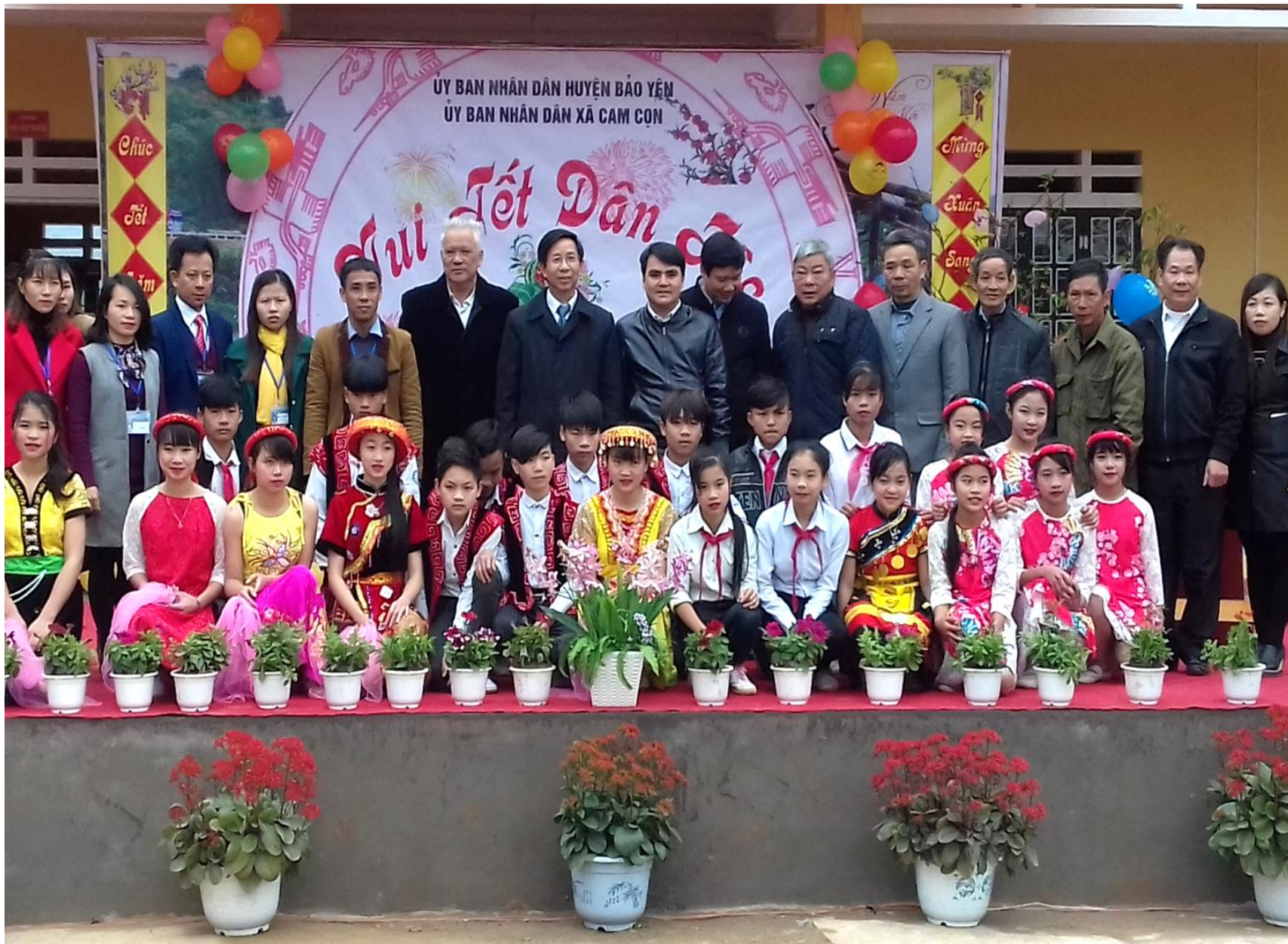
Cùng các quý vị đại biểu trong tết dân tộc