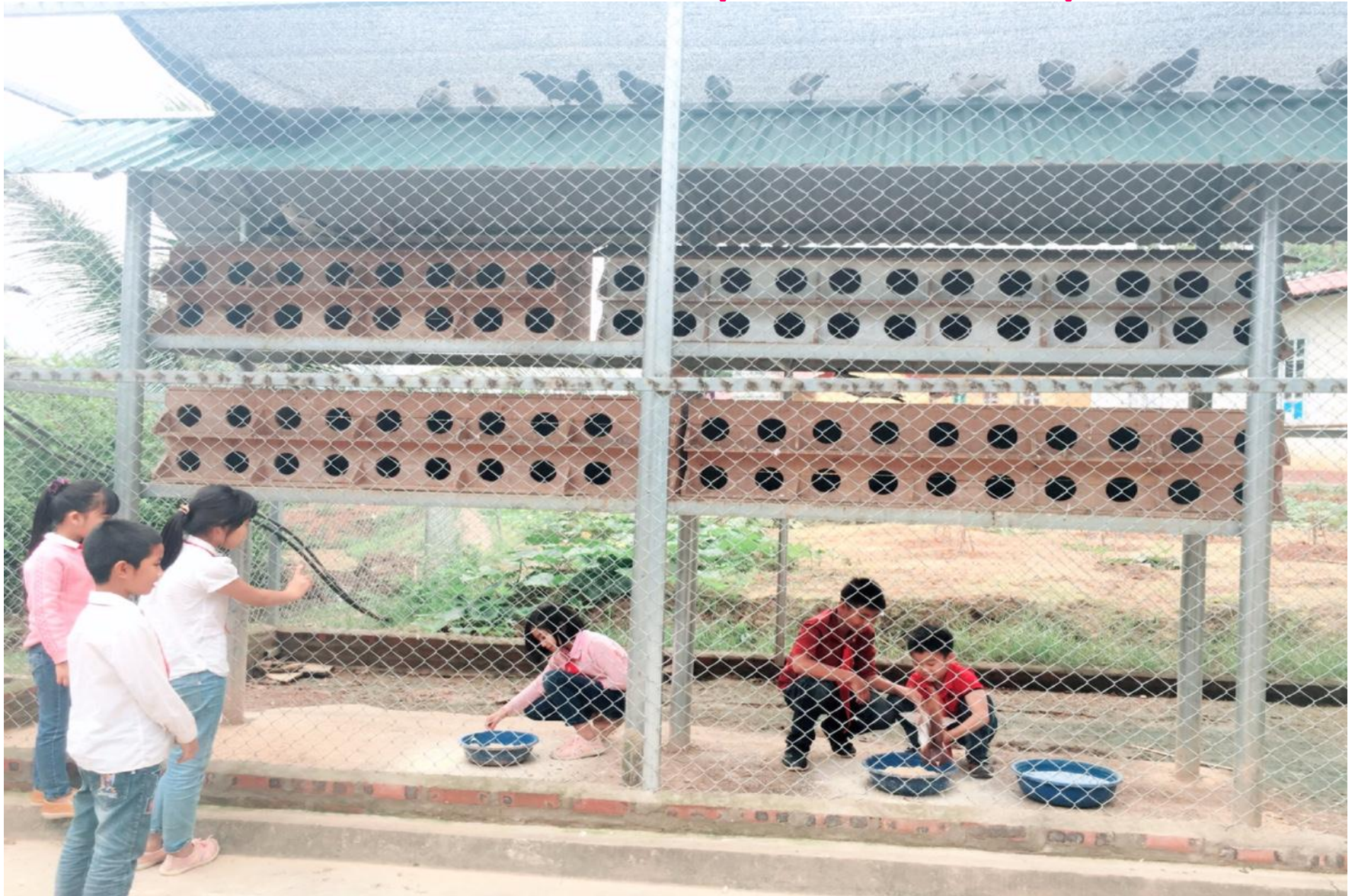
Chim bồ câu