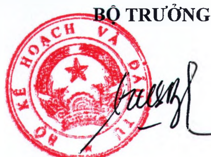
BỘ TRƯỞNG Nguyễn Chí Dũng