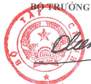
Đinh Tiến Dũng