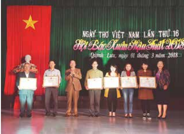
Lãnh đạo huyện trao Giấy khen các đơn vị đạt giải báo Xuân năm 2018