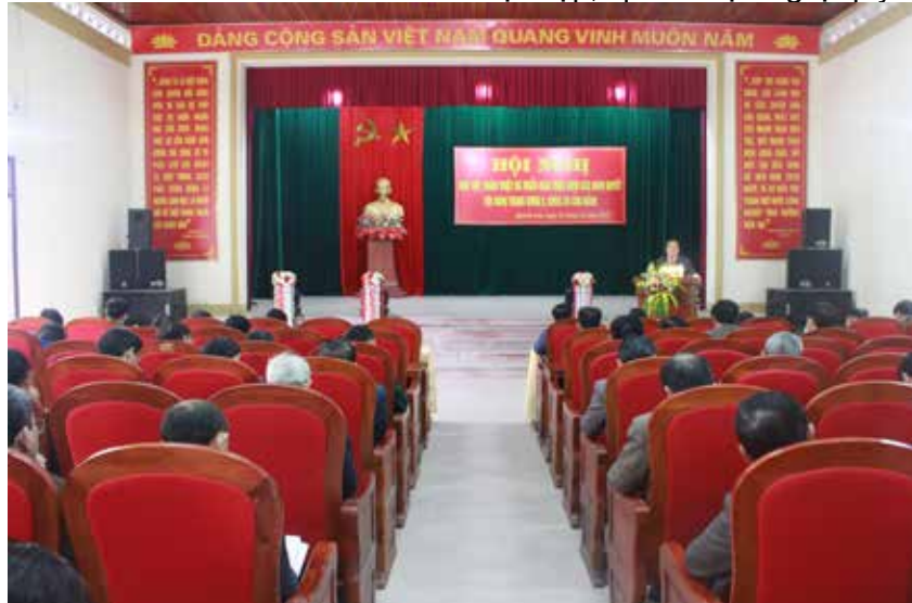
Hội nghị học tập, quán triệt Nghị quyết Trung ương 6, khóa XII

Để thực hiện Kế hoạch số 111-KH/TU về thực hiện Nghị quyết Hội nghị lần thứ sáu Ban chấp hành Trung ương Đảng khóa XII “Một số vấn đề về tiếp tục đổi mới, sắp xếp tổ chức bộ máy của hệ thống chính trị tinh gọn, hoạt động hiệu lực, hiệu quả”, Ban Thường vụ Huyện ủy đã xây dựng Kế hoạch số 166-KH/HU ngày 2/2/2018 về thực hiện Nghị quyết số 18-NQ/TW. Theo kế hoạch, đối với hệ thống tổ chức đảng có 32