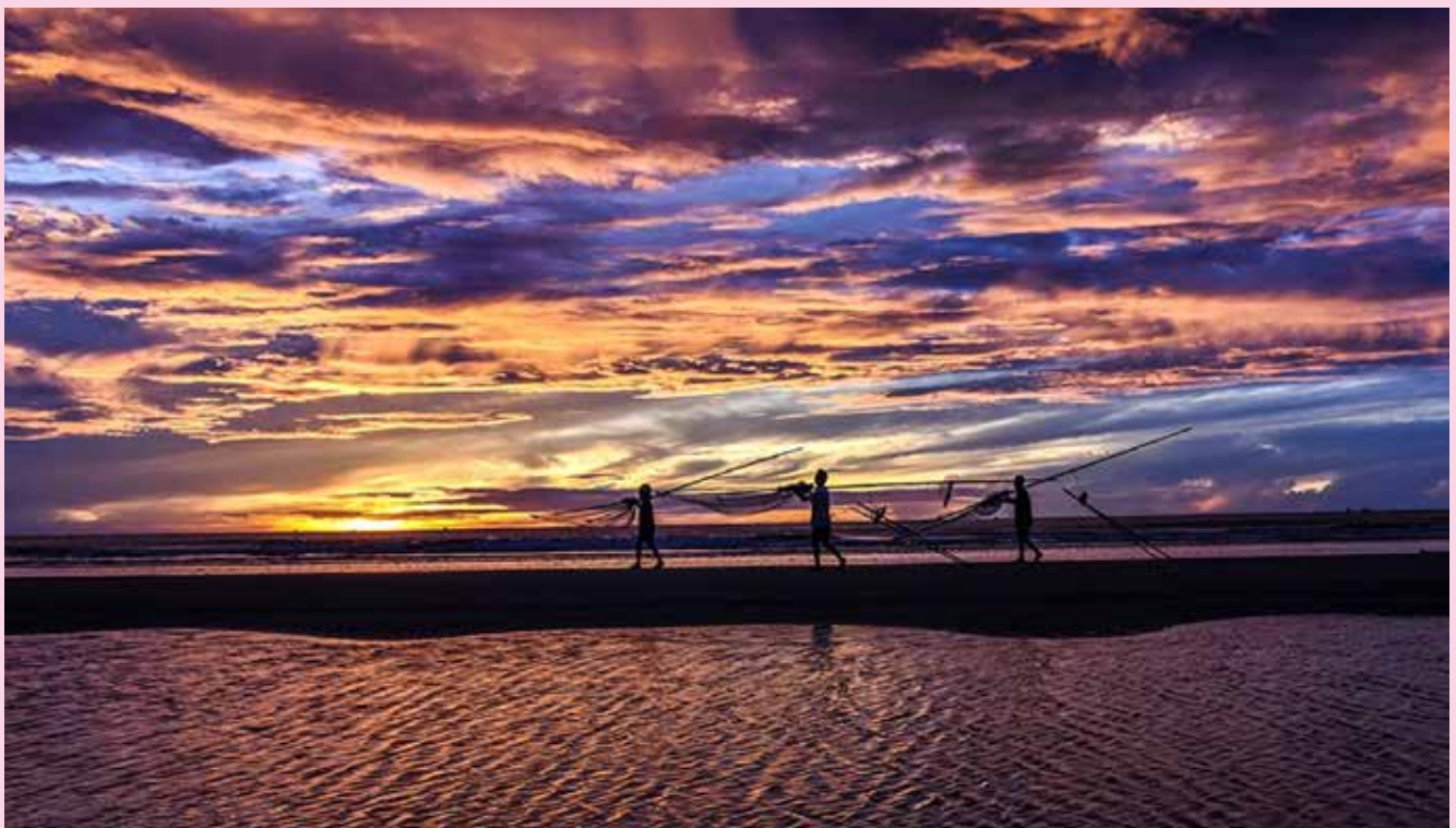
Biển Quỳnh đã đẹp, nhưng trong ánh bình minh còn tinh khôi và tuyệt vời hơn. Bầu trời và biển cùng khoác lên lớp áo sắc màu rực rỡ, không gian từ từ chuyển mình bừng sáng. Chính vì thế, du lịch biển Quỳnh luôn sẵn sàng chào đón du khách ghé thăm