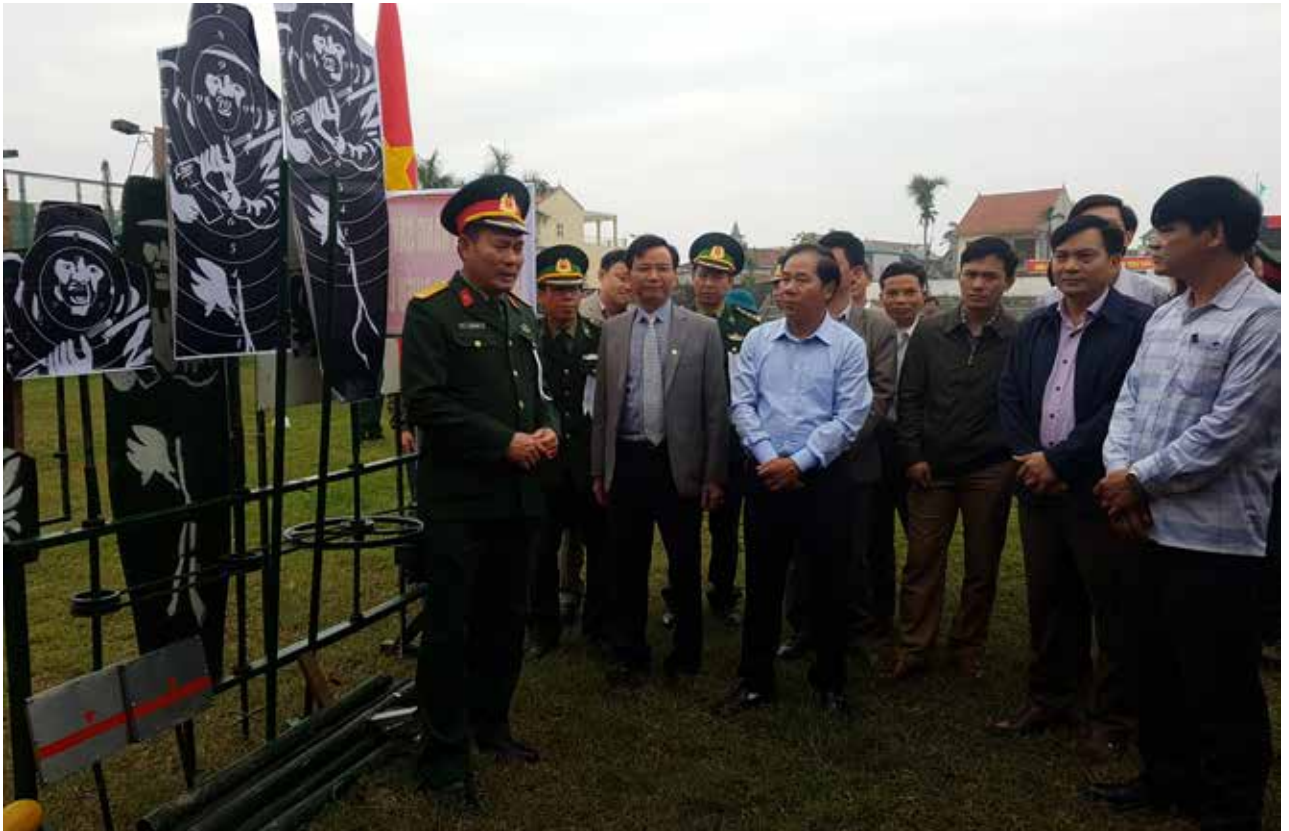
Lãnh đạo huyện thăm sáng kiến, cải tiến mô hình học cụ trang thiết bị năm 2018