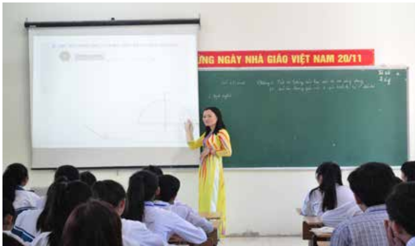
Tiết học thao giảng môn Toán lớp 10

Tăng cường công tác giáo dục chính trị, tư tưởng, nâng cao nhận thức về ý thức, trách nhiệm của mỗi cán bộ, giáo viên và học sinh. Từ đó, đòi hỏi mỗi thầy, cô giáo và học sinh có nhận thức tốt, ý thức trách nhiệm cao, phấn đấu rèn luyện,