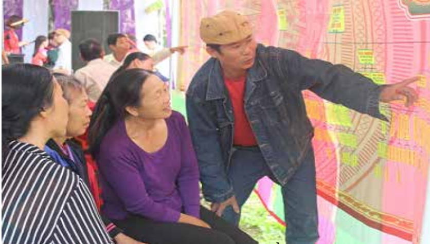
Con cháu họ Đào, xã Quỳnh Thuận tìm hiểu gia phả của dòng họ