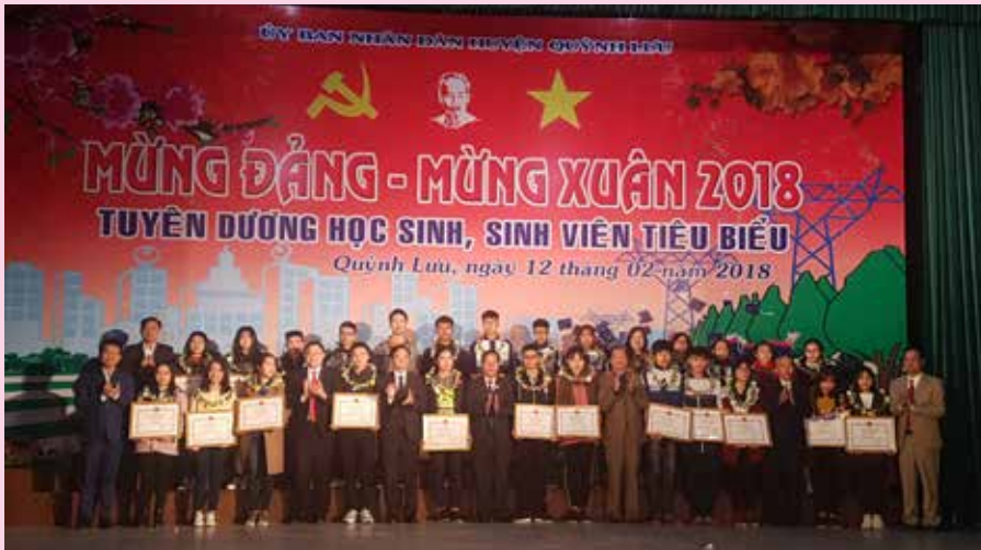
Giao lưu mừng Đảng, mừng Xuân 2018 và tuyên dương học sinh, sinh viên tiêu biểu

Giải Việt dã kỷ niệm 87 năm ngày thành lập Đoàn TNCS Hồ Chí Minh và 72 năm ngày Thể thao Việt Nam có 264 vận động viên tham gia thi đấu ở 2 nội dung: Chạy bền nữ 3.000m và nam 5.000m