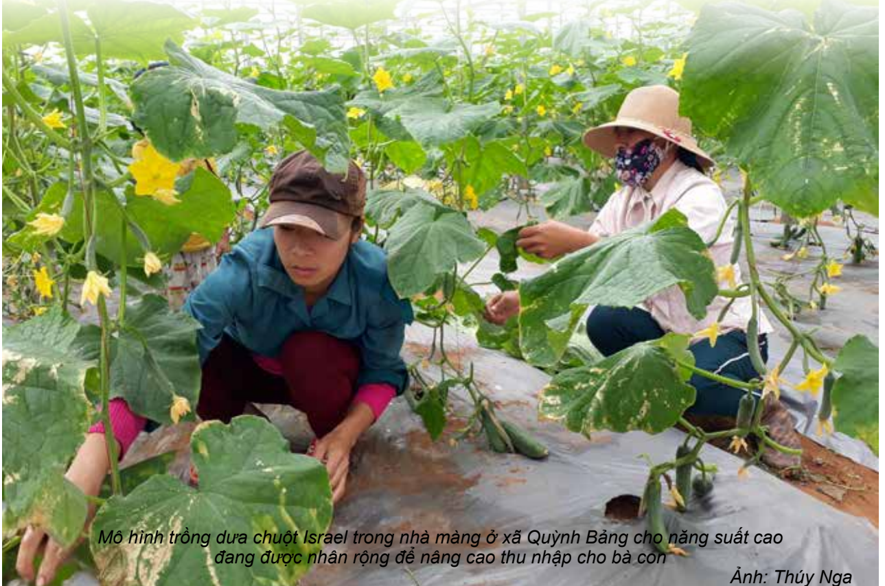
Mô hình trồng dưa chuột Israel trong nhà màng ở xã Quỳnh Bảng cho năng suất cao đang được nhân rộng để nâng cao thu nhập cho bà con

Trong cuộc kháng chiến chống thực dân Pháp xâm lược, Quỳnh Lưu là hậu phương lớn, là huyện tiên phong trong các