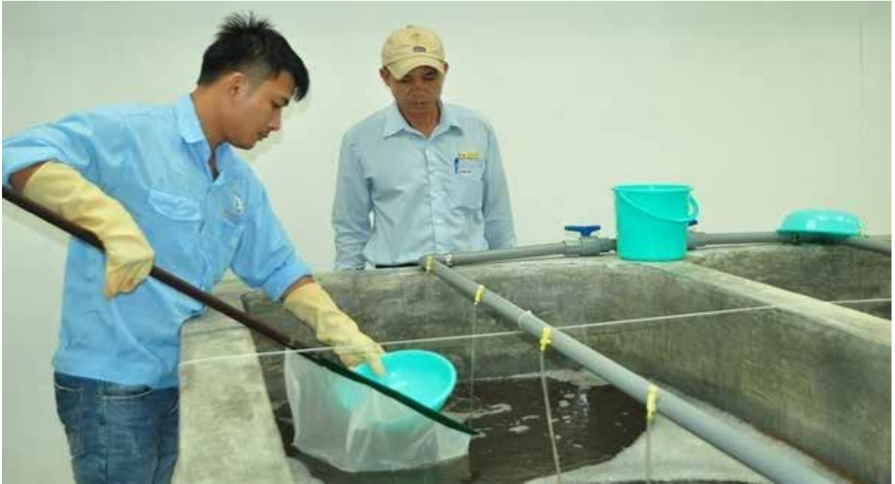
Ảnh: Công nhân kỹ thuật Công ty TNHH Việt Úc - Nghệ An kiểm tra, theo dõi sự phát triển của post giống tại bể

chân trắng rất hiện đại, đảm bảo quy trình chặt chẽ gồm 23 trại ương nuôi post con, 414 bể nuôi ương, các bể lắng lọc nước biển, bể nuôi tôm bố mẹ, khu vực chuẩn bị ấu trùng, phòng cấy tạo theo quy chuẩn... công suất 2 tỷ Post/năm, hệ thống bể xử lý, lắng lọc nước theo quy chuẩn. Hiện nay, Công ty đã cung cấp tới 60% thị phần tôm giống vụ 1 và khoảng 80% thị phần tôm giống vụ 2 trên địa bàn tỉnh Nghệ An”.