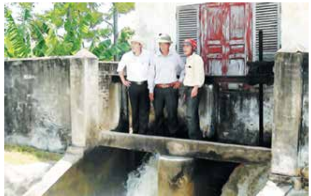
Cán bộ Xí nghiệp Thủy lợi huyện kiểm tra công tác vận hành bơm nước tại Trạm bơm Quỳnh Hồng

hỗ trợ diện tích tưới vùng hồ đập, phối hợp với UBND các xã, thị trấn thực hiện tiết kiệm chống lãng phí nguồn nước, ảnh hưởng đến năng suất cây trồng.