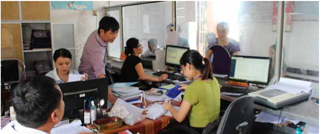
Thực hiện cải cách một cửa liên thông tại xã Sơn Hải góp phần giải quyết nhanh thủ tục cho người dân

sáng trong việc hiện thực hóa chủ trương nâng cao năng lực lãnh đạo và sức chiến đấu của tổ chức đảng. Đây là năm thứ 2 Huyện ủy tổ chức hội nghị giao ban cụm với các bí thư chi bộ trực thuộc đảng ủy xã, thị trấn. Đầu đặn 6 tháng một lần, các đồng chí Ủy viên Ban Thường vụ Huyện ủy phụ trách cụm chủ trì hội nghị giao ban để nắm bắt tình hình cơ sở. Qua đó giúp các đơn vị trao đổi kinh nghiệm