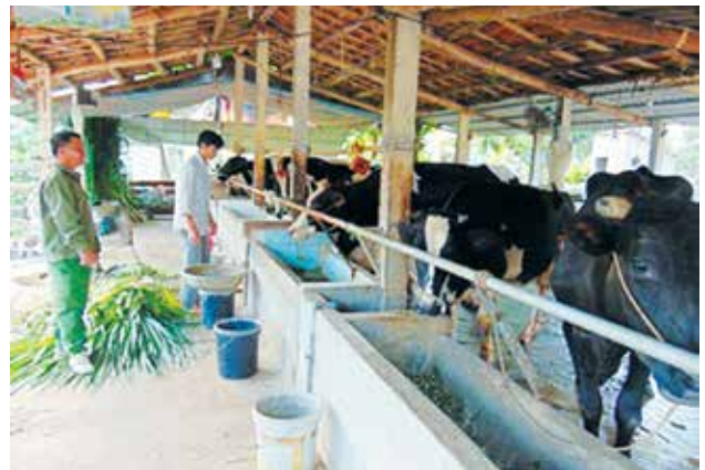
Phát triển kinh tế trang trại gắn với xây dựng nông thôn mới là hướng đi mới đang từng bước nâng cao đời sống nông dân xã Quỳnh Tam

Những năm qua, bằng nhiều giải pháp xã đã huy động được gần 73 tỷ đồng xây dựng các công trình phúc lợi; vận động nhân dân hiến được 20.000m 2 đất, 2.100m 2 bờ tường, gần 4.000 cây xanh, hoa màu. Với phương châm lấy dân làm gốc, mọi chủ trương, việc làm đều được bàn, trao đổi, xin ý kiến người dân nên đã nhận được sự đồng tình, ủng hộ của nhân dân. Đến nay, 100% đường liên xã và đường trục chính nội đồng của Quỳnh Tam được cứng hóa; 49,5km đường ngõ xóm (đạt 60%), 18km đường liên thôn (đạt 47%) được bê tông hóa. Bên cạnh đó, hệ thống lưới điện được quan tâm cải tạo, góp phần nâng cao