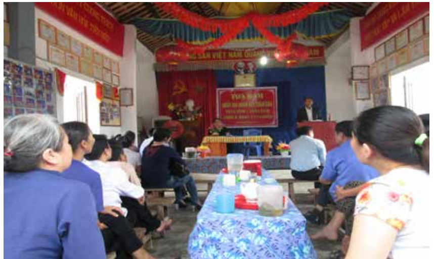
Tọa đàm ngày Đại đoàn kết toàn dân tộc

xấu Đảng, nói xấu chế độ của các phần tử cực đoan là muốn chia rẽ truyền thống đoàn kết bao đời của nhân dân ta. Bên cạnh đó, Ban công tác Mặt trận phân công Ban cán sự các chi hội thôn trực tiếp tuyên truyền,