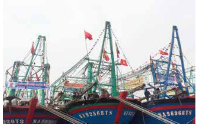
Ngư dân xã Tiên Thủy làm lễ Cầu ngư trước khi vươn khơi cầu mong một năm mới mưa thuận gió hòa đánh bắt hải sản đạt sản lượng cao

* Tại xã Sơn Hải: Sáng ngày 28/2 (Tức ngày 13 tháng Giêng âm lịch) tổ chức giải đua thuyền trên sông Thơi chào mừng lễ hội Cầu ngư 2018. Giải đua thuyền thu hút 6 đội đến từ các xã: Tiên Thủy, Quỳnh Long, Quỳnh Nghĩa, Quỳnh Thọ và 2 đội của xã Sơn Hải. Giải đua thuyền trên sông nằm trong chuỗi các hoạt động chào mừng lễ hội Cầu ngư hàng năm của địa phương. Sau 2 vòng đua, đội Tiên Thủy, Quỳnh Long, Sơn Hải xuất sắc lọt vào vòng chung kết. Với tinh thần thi đấu đoàn kết, cố gắng hết mình và được sự cổ vũ nhiệt tình của bà con nhân dân địa phương, đội đua thuyền xã Quỳnh Long đạt giải Nhất, đội