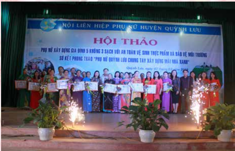
Có 33 chi hội của 33 xã, thị trấn được huyện khen thưởng vì có thành tích xuất sắc trong phong trào “Phụ nữ Quỳnh Lưu chung tay xây dựng mái nhà xanh”