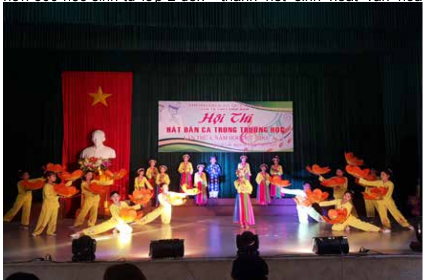
Tiết mục của trường Tiểu học Quỳnh Giang tham gia hội thi Hát dân ca trong trường học lần thứ 4, năm học 2017 - 2018

Có thể nói, Quỳnh Lưu là một trong những địa phương đầu tiên của tỉnh thực hiện phong trào đưa dân ca vào trường học, bằng nhiều hình thức khác nhau, dân ca trở thành nét sinh hoạt văn hoá