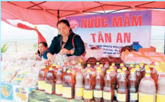
Hội Liên hiệp phụ nữ huyện trưng bày “Gian hàng xanh” dịp Khai trương du lịch biển nhằm giới thiệu các sản phẩm sản xuất sạch của hội viên phụ nữ