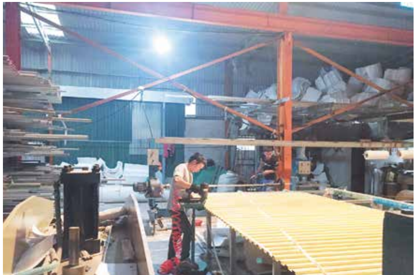
Công ty Thương mại và Dịch vụ Hiền Quỳnh, xóm 9 chuyên gia công các loại tôn lợp, kinh doanh sắt, thép đã tạo việc làm ổn định cho 8 nhân công với mức lương từ 4 đến 6 triệu đồng/người/tháng

duy trì, xã tham gia đầy đủ các hoạt động văn hóa văn nghệ do huyện tổ chức (4 năm liên tục đạt giải Nhất môn bóng chuyền bãi biển; năm 2016 đạt 2 giải Khuyến khích Việt dã Báo Tiền Phong; năm 2017 đạt giải Nhất toàn đoàn tại Đại hội Thể dục thể thao do huyện