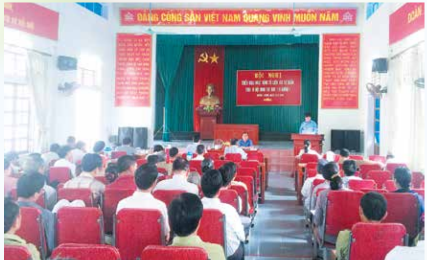
Ủy ban Mặt trận Tổ quốc huyện phối hợp với UBND xã Quỳnh Lương tổ chức hội nghị triển khai Tổ hoạt động tự quản theo tiêu chí 10 không

Bước đầu chỉ đạo, hướng dẫn, củng cố kiện toàn tổ chức các Tổ liên gia tự quản với 2.798 tổ/406 khu dân cư, thôn, khối, bản; phân công tổ trưởng, tổ phó, bình quân mỗi tổ có từ 15 - 30 gia đình liền kề nhau, mỗi khu dân cư có từ 5 - 7 tổ, duy trì chế độ sinh hoạt hàng tháng, tuyên truyền vận động nhân dân chấp hành chính