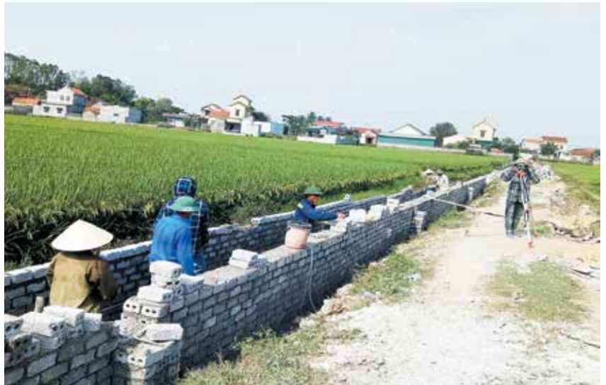
Xây dựng mương tưới, tiêu trên cánh đồng mẫu lớn được thực hiện từ sự đồng thuận của nhân dân

Có được kết quả trên, Ban Chấp hành Đảng bộ xã luôn coi trọng nguyên tắc tập trung dân chủ để nâng cao năng lực lãnh đạo và sức chiến đấu trong các chi bộ, đảng bộ địa phương. Để thực hiện tốt nguyên tắc này, Ban Chấp hành Đảng bộ xã luôn bổ sung, hoàn thiện quy chế làm việc của Ban Chấp hành, Ban Thường vụ Đảng ủy. Đồng thời, đề cao tinh thần trách nhiệm cá nhân; coi trọng tự phê bình và phê bình, tăng cường đoàn kết nội bộ, nâng cao nhận thức của cán bộ, đảng viên về nguyên tắc tập trung dân chủ trong các mặt công tác của Đảng thông qua việc quán triệt đầy đủ, sâu sắc