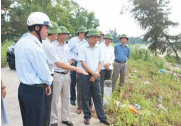
Đoàn kiểm tra tuyến đê biển tại xã Quỳnh Thọ