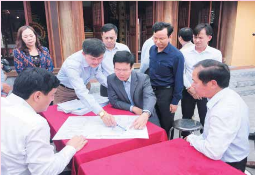
Đồng chí Võ Văn Thường Ủy viên Bộ Chính trị, Bí thư Trung ương Đảng, Trưởng ban Tuyên giáo Trung ương và các đồng chí lãnh đạo tỉnh, huyện nghe báo cáo quy hoạch, tiến độ tu bổ, tôn tạo, mở rộng khuôn viên Khu lưu niệm đồng chí Hồ Tùng Mậu

Đoàn công tác của Ủy ban Kinh tế Quốc hội khảo sát thực tế về xây dựng nông thôn mới tại huyện.