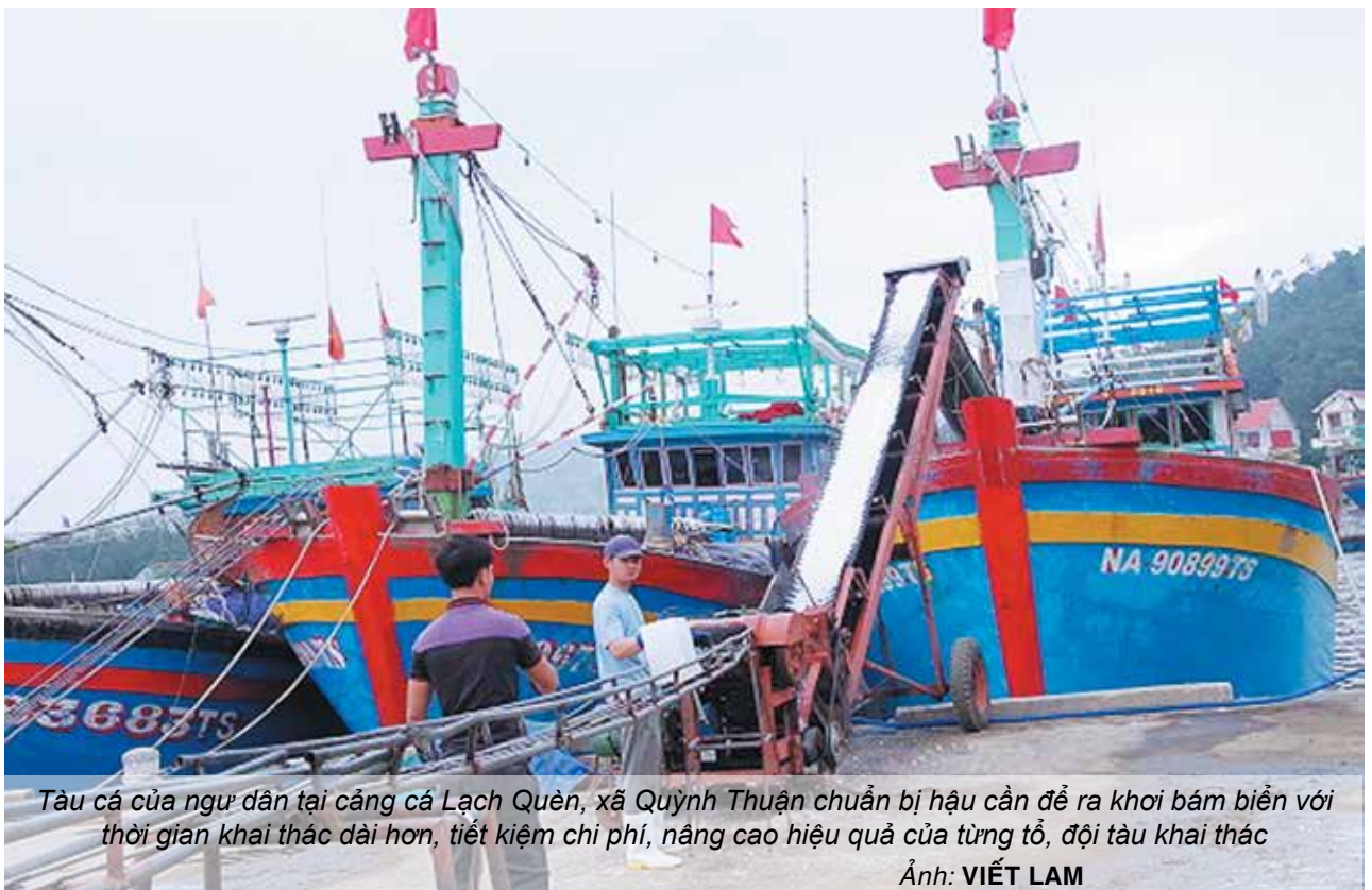
Tàu cá của ngư dân tại cảng cá Lạch Quèn, xã Quỳnh Thuận chuẩn bị hậu cần để ra khơi bám biển với thời gian khai thác dài hơn, tiết kiệm chi phí, nâng cao hiệu quả của từng tổ, đội tàu khai thác

1. Phát triển đội tàu khai thác xa bờ công suất lớn với các nghề khai thác sản phẩm có giá trị kinh tế cao, sắp xếp cơ cấu nghề khai thác hợp lý trên cơ sở giảm các nghề khai thác hủy diệt, ảnh hưởng tới