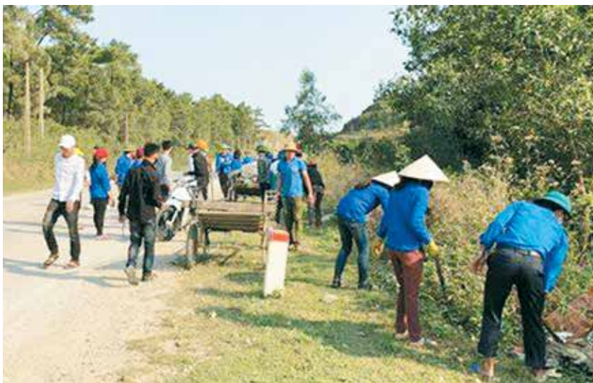
Đoàn viên, thanh niên xã tổ chức tổng dọn vệ sinh môi trường tại Dốc Lèn thôn 12

tuyên truyền phổ biến giáo dục pháp luật và tuyên truyền sức khỏe sinh sản cho lứa tuổi vị thành niên. Đổi mới hình thức tuyên truyền bằng sân khấu hóa, tổ chức hội thi “Rung chuông vàng”, các trò chơi gắn với trả lời câu hỏi. Định hướng thông tin chính thống trên mạng xã hội, nhằm tăng cường công tác tuyên truyền, phòng chống tệ nạn xã hội, cảnh giác trước các luận điệu xuyên tạc, vu khống của các thế lực thù địch. Đưa tin, viết bài các phong trào do Đoàn xã tổ chức để gắn kết đoàn viên, thanh niên đang làm ăn và sinh sống trên