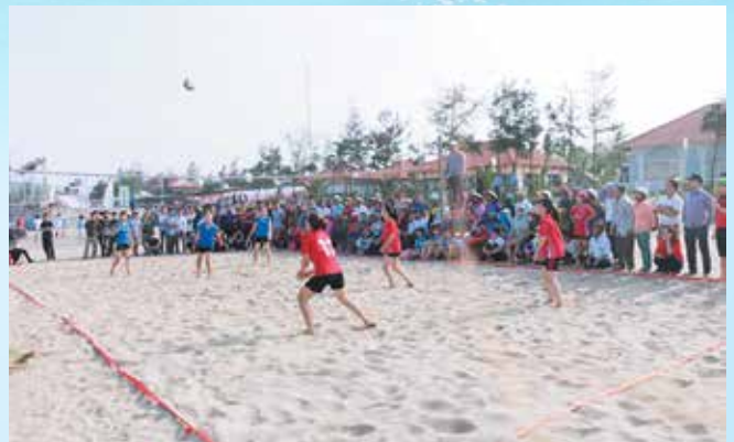
Tham gia giải Bóng chuyền nam, nữ trên cát Khai trương du lịch biển Quỳnh có 31 đội. Kết thúc giải, đội nữ xã Quỳnh Mỹ đạt giải Nhất; đội nam xã Quỳnh Châu đạt giải Nhất