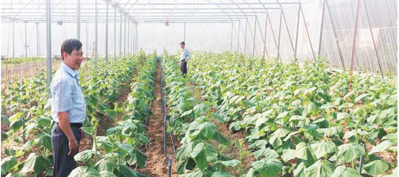
Canh tác rau an toàn trong nhà màng tại xã Tân Sơn - Mô hình sản xuất theo quy trình VietGAP đang được nhân rộng trên địa bàn

Là huyện đồng bằng ven biển, có chiều dài bờ biển hơn 19,5km. Sau khi chia tách thị xã Hoàng Mai, Quỳnh Lưu cơ bản là huyện nông nghiệp với tỷ trọng chiếm hơn 40% cơ cấu kinh tế, hoạt động nông nghiệp phụ thuộc nhiều vào thiên nhiên. Năm 2017, huyện chịu ảnh hưởng trực tiếp của cơn bão số 2, số 10 và 1 đợt áp thấp nhiệt đới, gây mưa lớn trên diện rộng, làm thiệt hại ước tính trên 182 tỷ đồng.