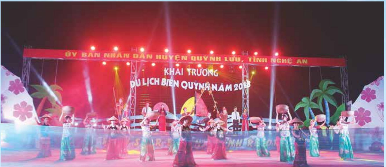
Tiết mục “Giữa mạc tư khoa nghe câu hò Nghệ Tĩnh” của đội nghệ thuật quần chúng xã Quỳnh Mỹ đạt giải Nhất tại Liên hoan tiếng hát Làng Sen huyện