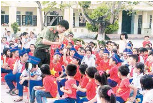
Chiến sỹ Công an huyện trao đổi với học sinh về vấn đề an toàn giao thông đường bộ

Tại buổi tuyên truyền, học sinh được các chiến sỹ Công an huyện trao đổi về thực trạng sử dụng ma túy đá trong thanh, thiếu niên trên địa bàn xã Sơn Hải, tác hại của ma túy đối với