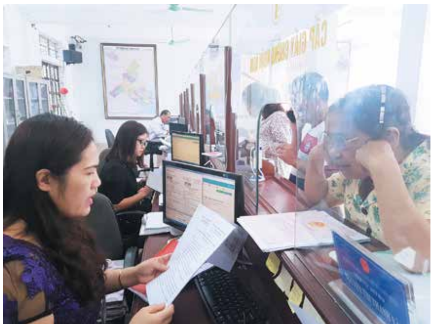
Người dân làm thủ tục hành chính tại bộ phận “Một cửa” huyện

một cửa, một cửa liên thông tại UBND huyện và 33/33 xã, thị trấn tiếp tục được cải thiện, từng bước đáp ứng yêu cầu giao dịch của tổ chức, công dân trên địa bàn. Các phòng, cơ quan chuyên môn UBND huyện công khai lịch công tác, biển tên và chức danh của công chức để cơ quan, đơn vị và công dân thuận tiện giao dịch; đồng thời làm cơ sở để giảm việc thực thi công vụ của cán bộ, công chức. Thời gian giải quyết thủ tục hành chính cho công dân, tổ chức được rút ngắn như: Thủ tục cấp đổi giấy chứng nhận quyền sử dụng đất từ 20 ngày xuống 15 ngày; thủ tục chuyển nhượng quyền sử dụng đất từ 20 ngày xuống 13 ngày; thủ tục