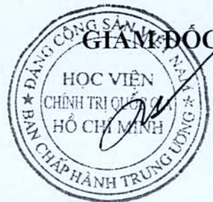
Nguyễn Xuân Thắng