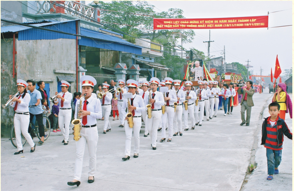
Lễ rước bằng khu dân cư văn hóa thôn Tây Lạc, xã Đông Sơn

khuyến học, khuyến tài tiếp tục được phát huy có hiệu quả, nhiều dòng họ được UBND huyện trao bức trướng dòng họ khuyến học, khuyến tài. Các giá trị thuần phong mỹ tục được duy trì, phát triển, những biểu hiện lạc hậu mê tín dị đoan đã kịp thời được ngăn chặn. Việc cưới, việc tang đã tổ chức theo nghi thức mới lịch sự, tiết kiệm. Những kết quả trên gắn liền với phong trào “Toàn dân đoàn kết xây dựng đời sống văn hóa” góp phần vào cuộc vận động “Toàn dân chung tay xây dựng Nông thôn mới”.