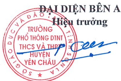
Lưu Văn Khải

Hai bên đồng ý, thống nhất ký tên. Biên bản được lập thành 02 bản, mỗi bên giữ 01 bản có giá trị pháp lý như nhau.