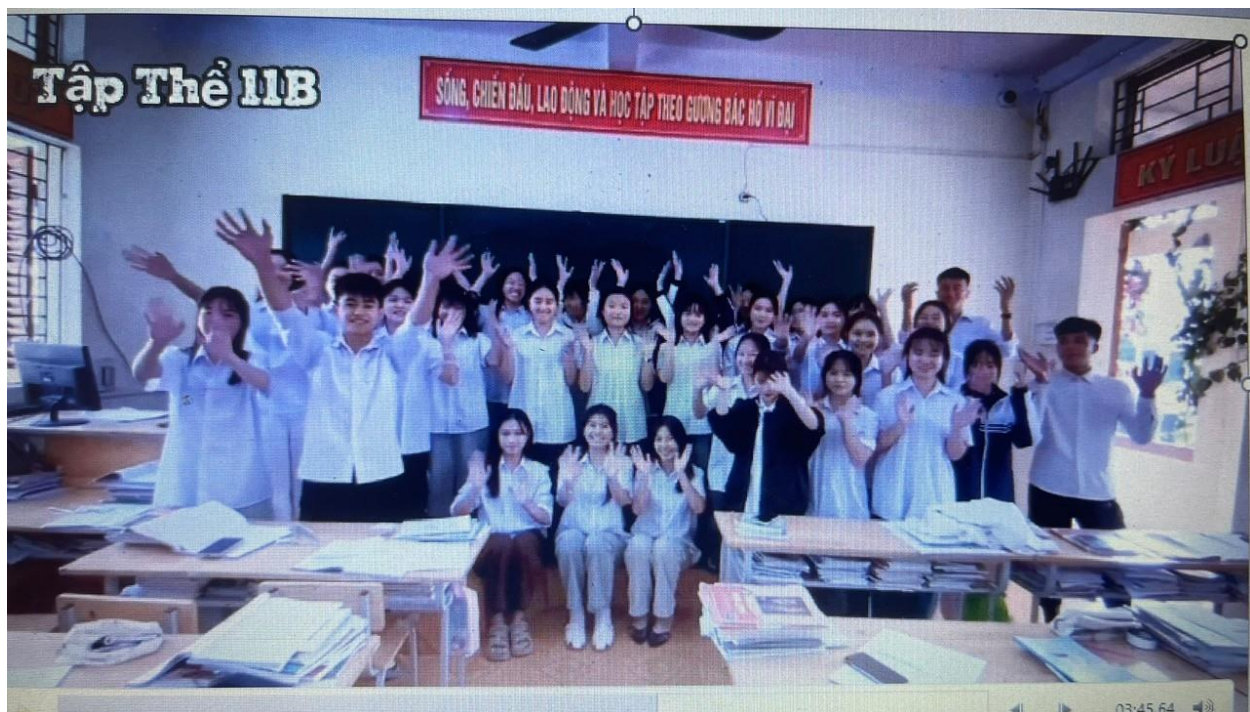
Học sinh các lớp gửi “Thông điệp yêu thương”

Bên cạnh đó, học sinh toàn trường còn hào hứng tham gia nhiều hoạt động giao lưu, trò chơi tập thể như: hái hoa dân chủ, đuổi hình bắt chữ, trò chơi vận động “Gắn kết yêu thương”. Các hoạt động không chỉ mang lại tiếng cười sôi nổi mà còn giúp các em nâng