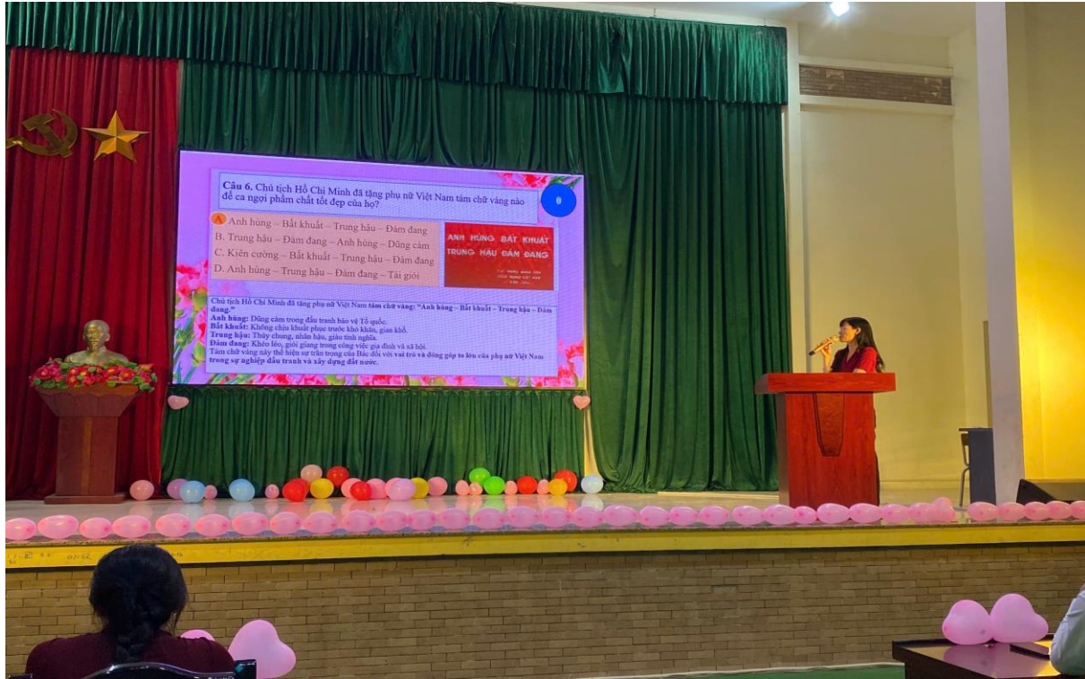
Trò chơi “hái hoa dân chủ”

cao hiểu biết về ý nghĩa của ngày 8/3 và 20/3, đồng thời rèn luyện kỹ năng giao tiếp, tinh thần đoàn kết và sự sẻ chia trong tập thể.