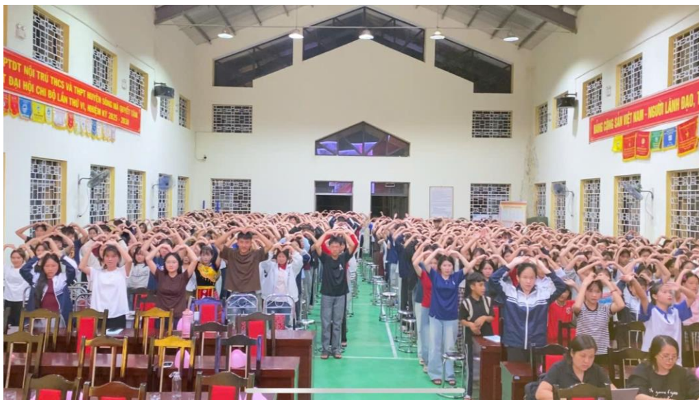
Màn đồng diễn “Mẹ yêu ơi” do các em học sinh thể hiện

Khép lại chương trình là phần đồng diễn “Mẹ yêu ơi” đầy cảm xúc của học sinh toàn trường, như một lời tri ân sâu sắc gửi tới những người phụ nữ thân yêu – những người luôn âm thầm yêu thương, hy sinh và đồng hành trong cuộc sống.