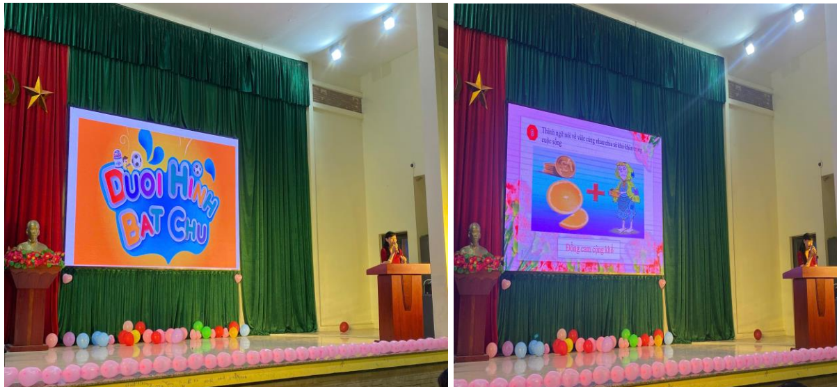
Trò chơi “Đuổi hình bắt chữ”