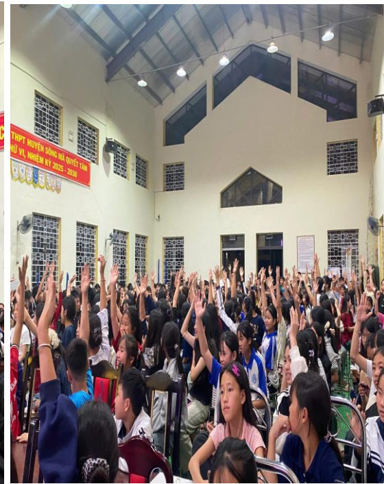
Học sinh hào hứng, tham gia các hoạt động trong chương trình