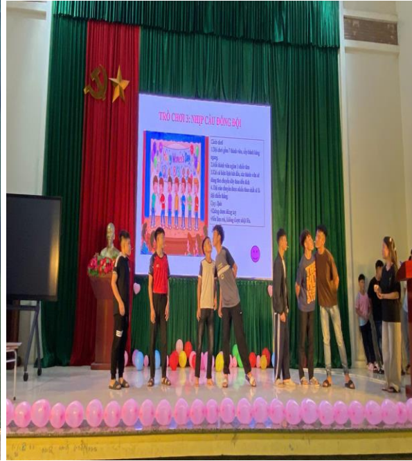
Trò chơi “Nhịp cầu đồng đội”